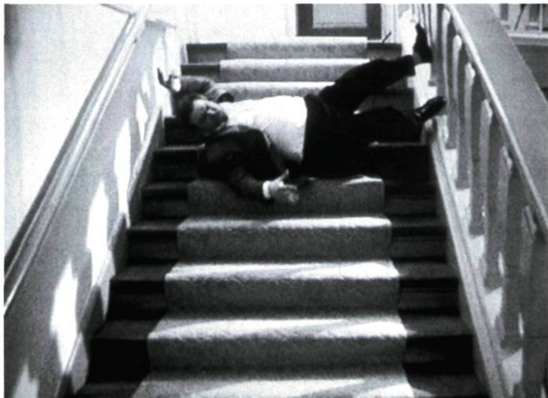
Peter Land, The Staircase , 1998. Projection vidéo double. Présenté à Culbutes, Montréal.

L a réflexion sur l'art a souvent pour effet de mettre à distance l'objet de désir du regardeur initié ou du critique d'art. Le discours sur l'art en dehors de la critique journalistique tente d'évacuer tout jugement de valeur et tout affect ressentis par l'auteur pour garder un rapport le plus objectif possible avec l'œuvre. Dans les deux cas, c'est du refus de la subjectivité que le discours procède. Mais on sait très bien qu'une relation intersubjective s'instaure dès qu'il se manifeste de l'intérêt pour un objet, esthétique ou non. D'où naîtrait peut-être l'arbitraire dans le jugement esthétique : n'a-t-il pas provoqué la crise de l'art, qui est en fait une crise de critères dont les Heinich, Rochlitz et Michaud débattent depuis quelques années ?