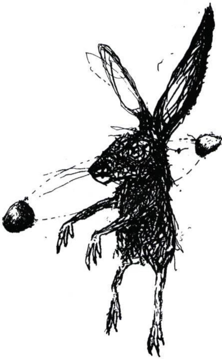
Sylvain Bouthilllette, dessin, 1999.

s'instaure un effet d'étrangeté et de malaise. Ce qui s'oppose à ce qui était attendu d'une œuvre au début du siècle.