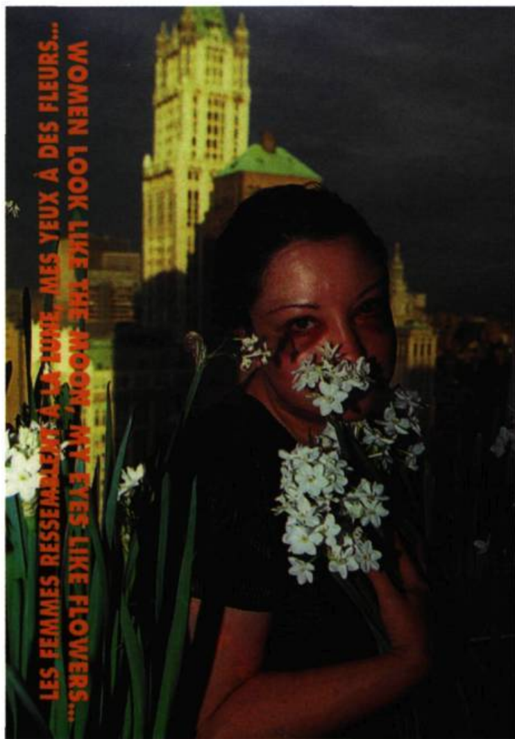
Orlan, Les femmes ressemblent à la lune, mes yeux à des fleurs... , 1993. Performance réalisée à New York. Photo faite après la 7 e opération chirurgicale. Sandra Gering Gallery.

M. L. C. : Supposons que la représentation soit d'abord un récit de soi permettant de construire et d'intégrer mon expérience. Dès lors, l'effondrement symbolique est une perte des moyens de s'auto-biographier, perte des moyens dérivés de symboliser, perte de la capacité du corps de symboliser : tout est trauma. Si on ne sait plus se raconter à soi-même ce que l'on est, on n'a plus que le