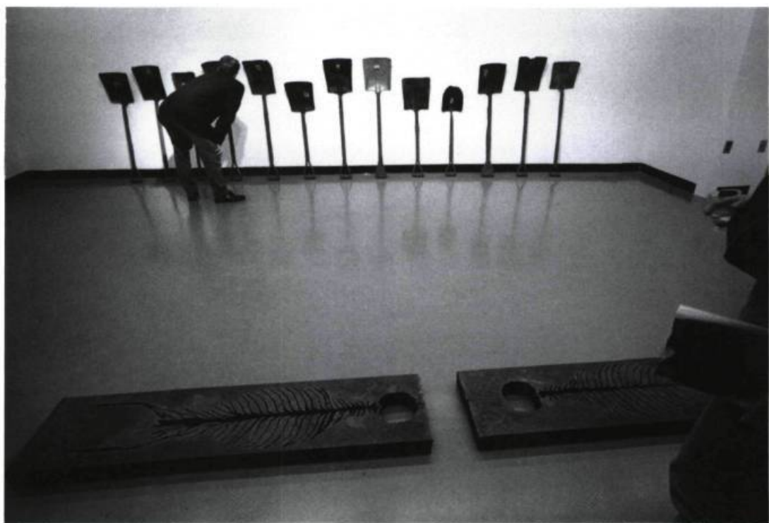
Premier plan : détail d'une sculpture-installation de John McEwen ; arrière plan : une sculpture de Naomi London. Galerie Samuel Lallouz.

Le véritable temps fort d'ELAAC, cependant, demeure à mon avis le volet Coups de cœur , créé en 1989 dans le but de fournir une tribune aux artistes de la relève non représentés en galerie. Coups de cœur a été repris en 1990 avec bonheur grâce au magnifique travail de la conservatrice invitée, Madeleine Hivon. De nouveau axée sur l'installation et le grand format, cette seconde édition rendait en premier lieu un hommage à l'excellence de l'œuvre de Linda Covit et présentait, également, les démarches de neuf jeunes artistes.