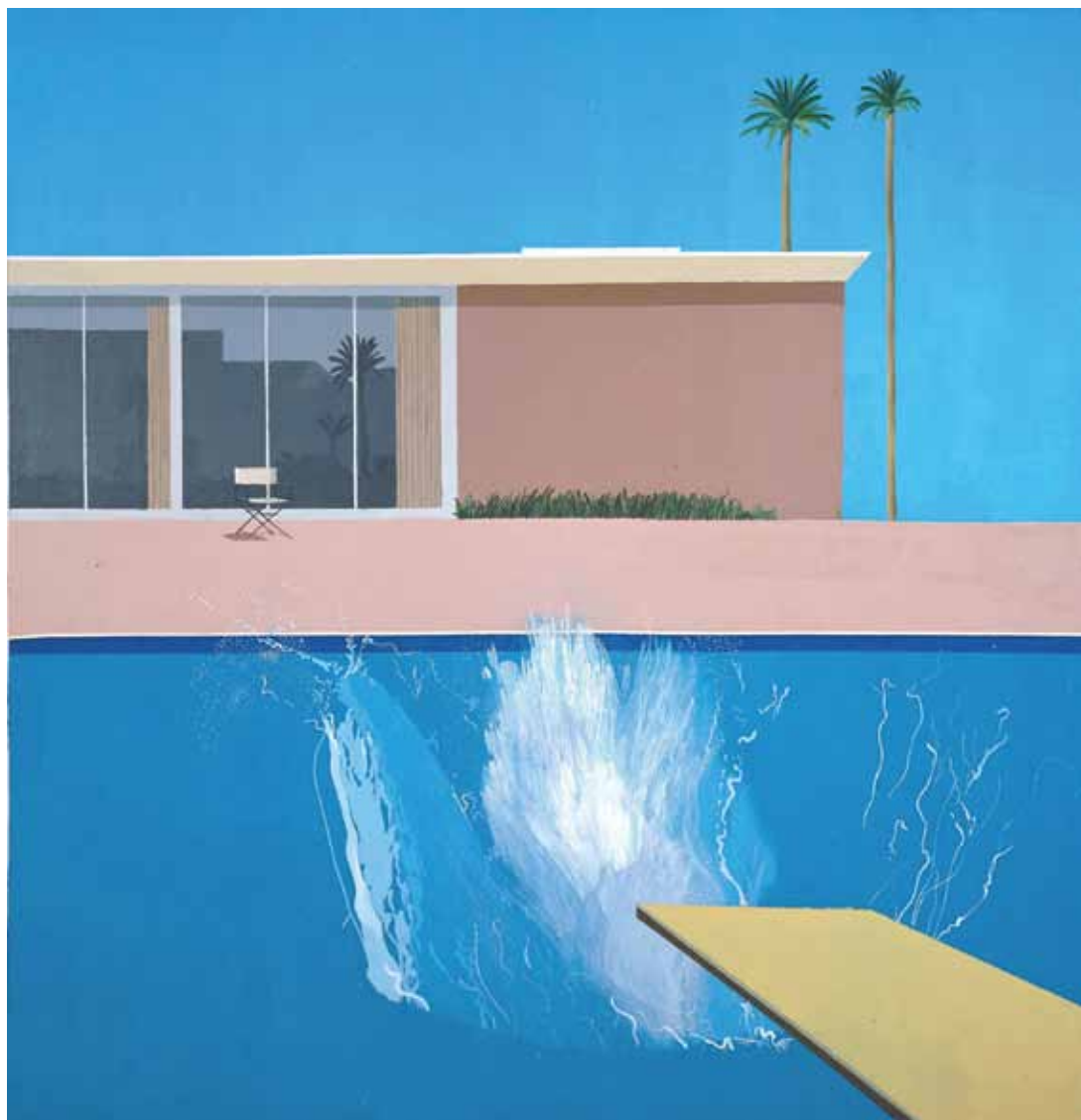
David Hockney, A Bigger Splash , 1967. Tate. Acquisée en 1981. © David Hockney.