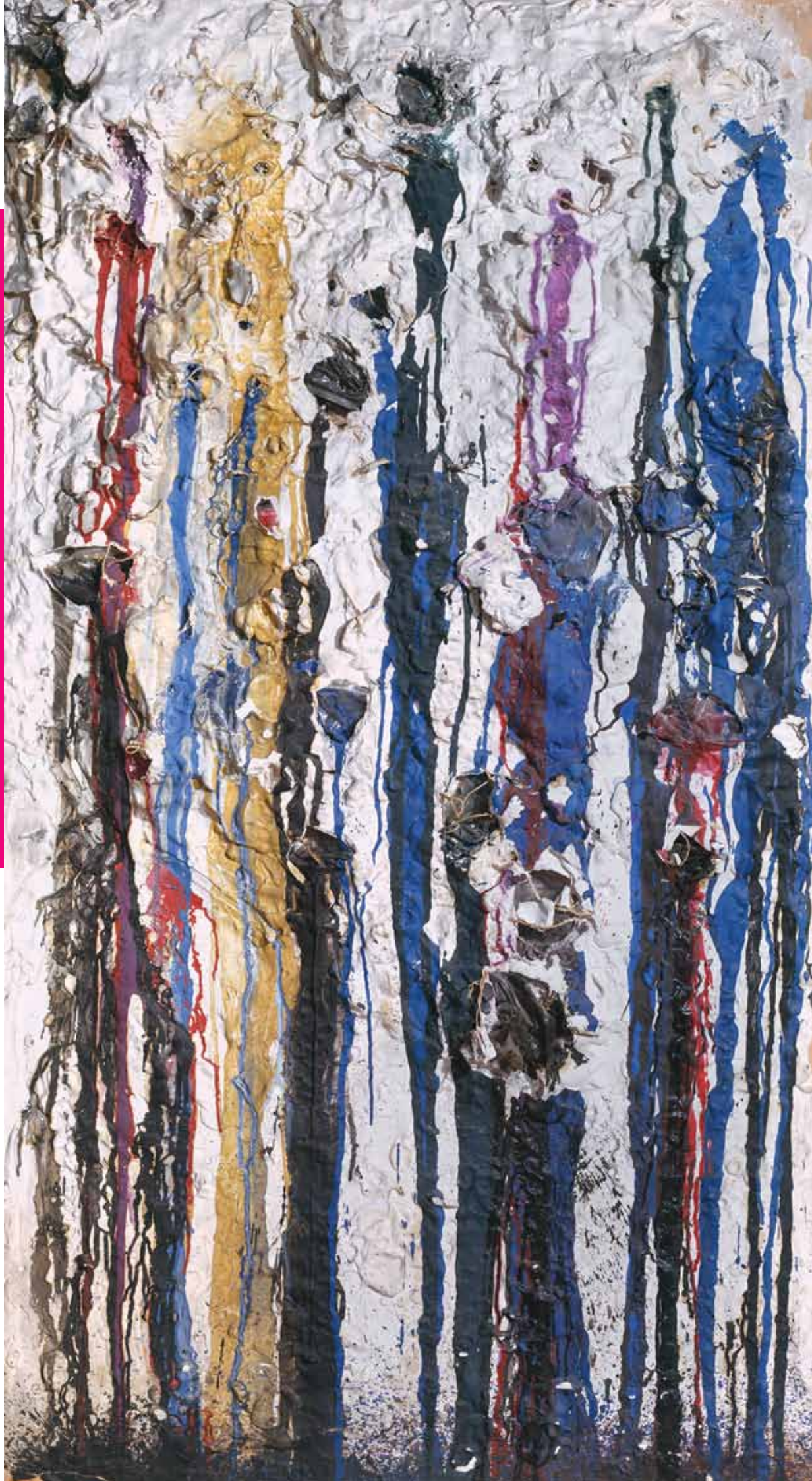
Niki de Saint Phalle, Shooting Picture , 1961, © The Estate of Niki de Saint Phalle.