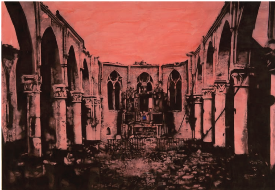
Marc Séguin, Ruine n° 4 , 2010. Huile fusain et sang d'agneau sur toile ; 275 x 396. © Marc Séguin (SODRAC 2012).