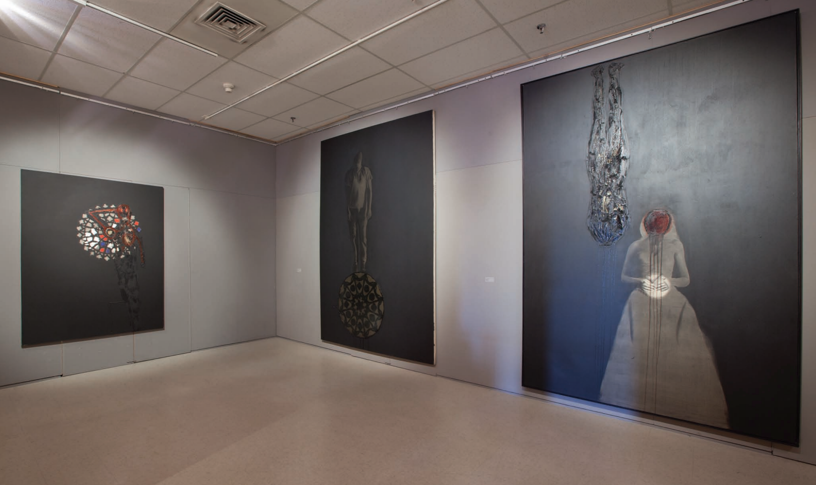
Marc Séguin, Vue partielle de l'exposition. © Marc Séguin (SODRAC 2012).

Demon. Boy's Dream (Birkenau). Sarajevo. Forêt No 6. Roadkill. Crâne. Souffle-Cri. Paysage près de Pusan Corée du Sud... L'art et la pensée se compénètrent dans un lieu incertain, peut-être même aux enfers, sans fil d'Ariane pour nous reconduire à la lumière. Nous sommes dans des bois sacrés où le chasseur d'idées débusque désastres et catastrophes trop humaines. Dans la mire du tableau, le peintre envisage la mort qui surgit avant de faire feu et alors le tableau tombe sous le joug de l'absence, le règne des cendres et le poids des disparus. On sent bien la démesure du souffle, de l'effroi devant tant de fractures et de violence intérieures et millénaires. Le tableau, ce secret dernier des choses, n'est plus lui-même qu'une nature morte, littéralement, alors que l'empire allégorique s'empare de la surface moins colorée qu'endeuillée et grouille sur la chair du monde avariée. Qu'importe les diverses séries rassemblées pour l'exposition, quels que soient les genres empruntés - portraits, autoportraits, paysages ou nature morte -, toutes les scènes sont encadrées, confinées, limitées, contraintes, rabattues comme on rabat une couleur de noir, par cette finalité fatale, la mort, brute et brutale, qui n'a de chance d'occuper tout le territoire qu'en faisant fond sur l'ensemble de la démarche de Séguin en dépit des taches