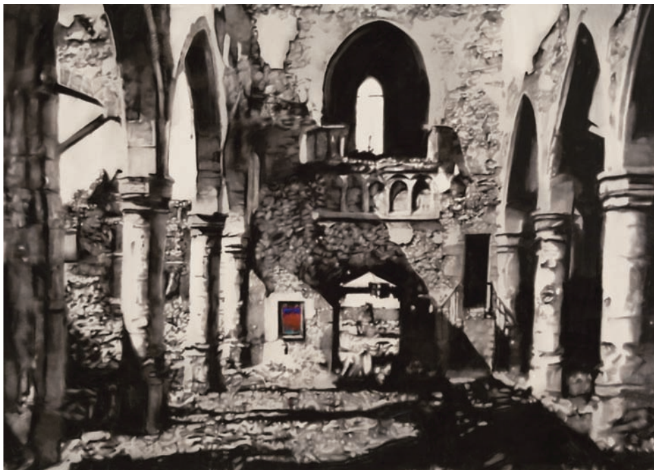
Marc Séguin, Ruine n° 4 , 2010. Ruine n° 2 , huile, fusain et cendre sur toile, 2010, 152,5 x 213 cm © Marc Séguin (SODRAC 2012).