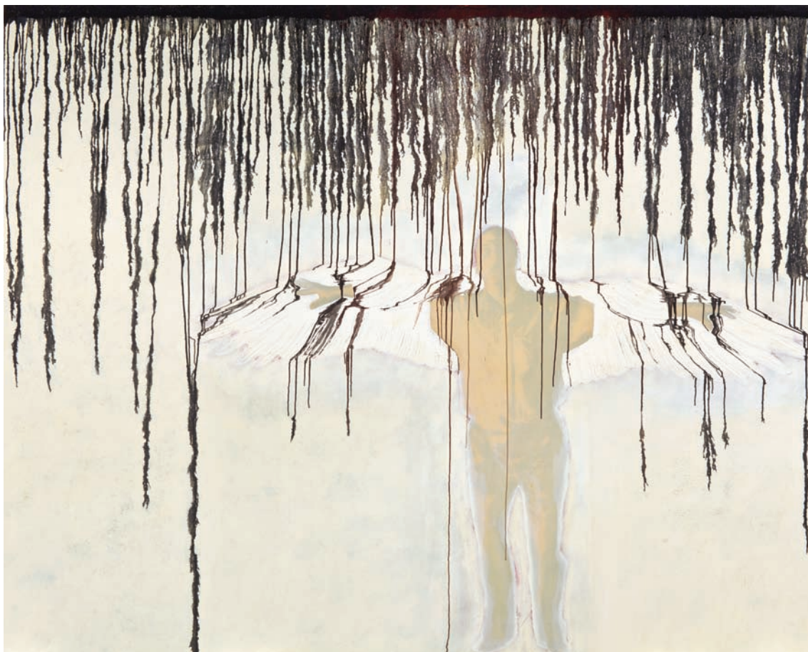
Marc Séguin, L'ange , 2002. Huile sur toile ; 240 x 300 cm. © Marc Séguin (SODRAC 2012).

provocantes de couleurs qui trouent parfois l'espace pictural. L'œuvre de la mort n'est pas infailliblement noir sur noir, gris sur gris; elle peut surgir aussi dans un coup d'éclat rouge, sous un lambeau de peau. Il nous faut apprendre à reconnaître la couleur du sang d'agneau. Ruine No 4 . Tout ça appartient irrémédiablement à une même famille d'esprit empreinte de réminiscences innombrables de tragédies plus mémorables. La chasse est une pratique venue du fond des âges. Ça dialogue et ça s'entrechoque entre Éros et Thanatos, entre le totémique et le profane. Sang, Sexe et Sacré. Mezzotinte ou manière noire, huile et goudron, cendres et fusain matérialisent cet œuvre au noir traversé de cris et de crânes, d'anges déçus et de ruines maudites. Ni paisible ni douce, la mort n'est ici que terreur et épouvante, vacarme et sinistre. Dans le sillage des Goya et, plus près de nous, de Beuys voire de Kiefer, tout l'œuvre de Marc Séguin qui arpente des propositions anciennes et modernes fait face au poids de la mort implacable.