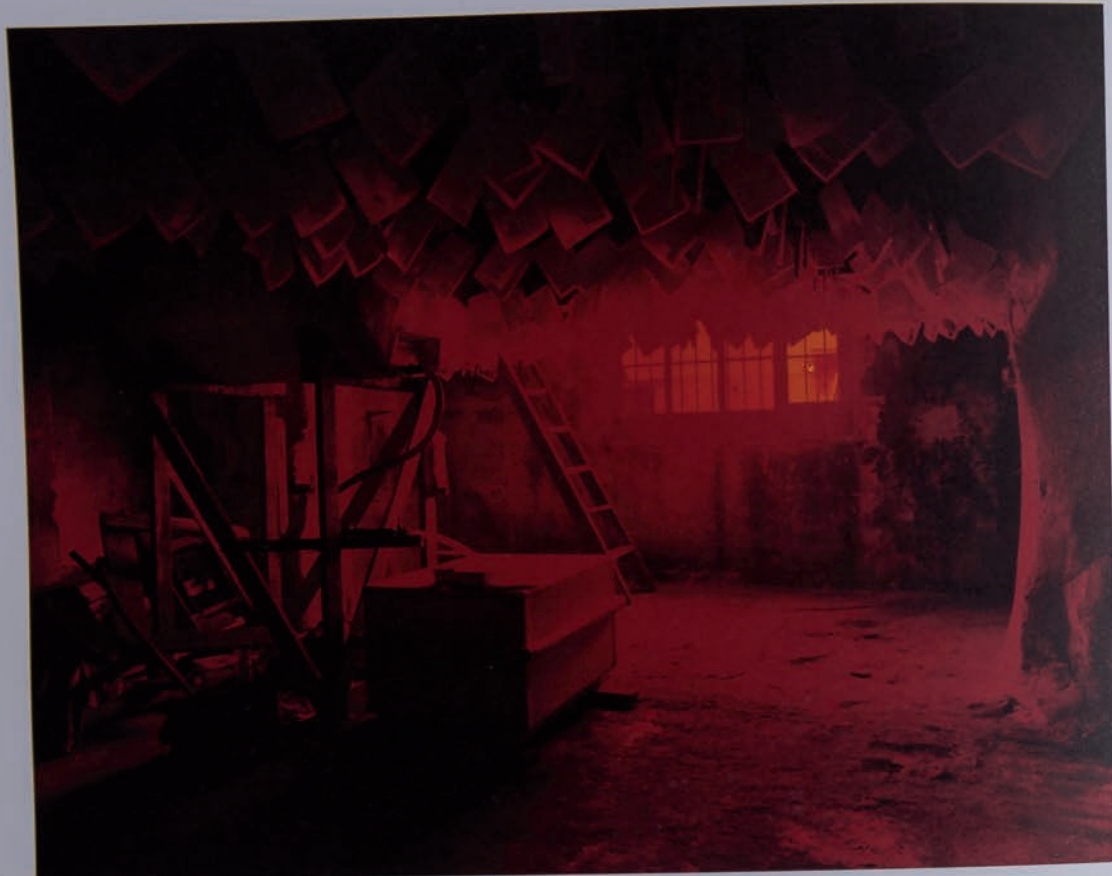
12 Magazin: Büyük Valide Han

MAGAZIN: BUYUK VALIDE HAN, 8 th , INTERNATIONAL ISTANBUL BIENNIAL, 2003.