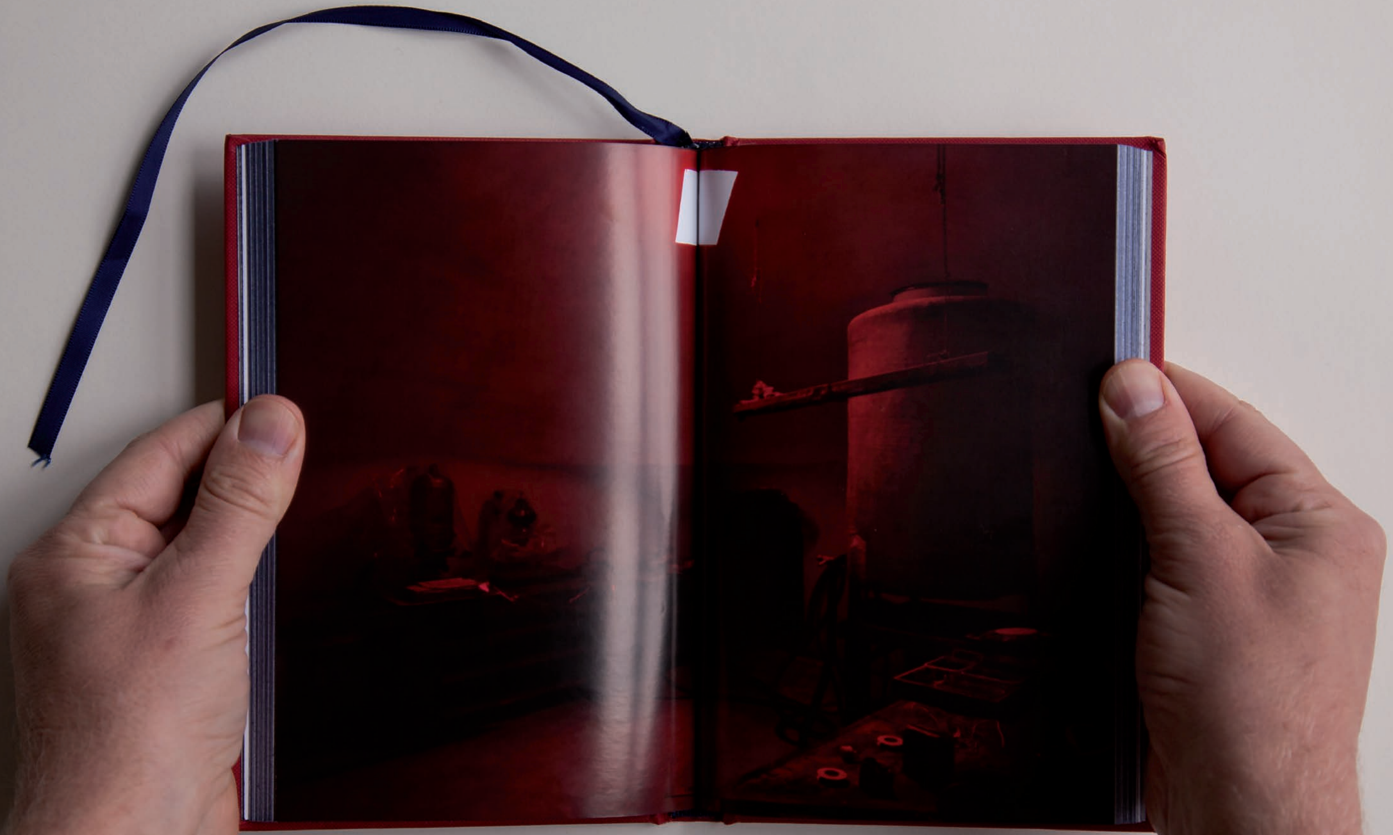
1. IMPOSTER, 54 TH INTERNATIONAL ART EXHIBITION—THE VENICE BIENNALE, VENICE, 2011.

REALISATION SPECTACULAIRE, LA CHAMBRE NOIRE OUT AVAIT ÉTÉ CRÉÉE AU DÉPART DANS LES PROFONDEURS DU VALIDE MAN, À ISTANBUL, A ÉTÉ ENTièrement RECONSTRuite MORCEAU PAR MORCEAU À L'INTÉRIEUR DU PAVILLON BRITANNIQUE LORS DE LA 54 E BIENNALE DE VENISE, EN 2011. DANS CETTE ŒUVRE, MIKE NELSON VA AU-DELÀ DU SIMPLE ACTE DE RÉASSEMBLAGE. IL INTERVIENT À UNE ÉCHELLE ARCHITECTURALE MONUMENTALE, AMÉNAGEANT ENTièrement LE PAVILLON BRITANNIQUE DANS LE BUT DE REPRODUIRE NON SEULEMENT L'EXPIÉRIENCE ORIGINALE DU VISITEUR DÉCOUVRANT LA CHAMBRE NOIRE DANS LE MAN, MAIS AUSSI LA SENSATION QU'IL A VECUE EN PARCOURANT L'ENCHEVÊTEMENT DE COULOIRS, DE COURS INTÉRIEURS, DE CORRIDORS, DE SALLES D'ENTRÉPOSEGE ET D'ESCALIERS AVANT D'ACCÉDER À LA PIÉCE ROUGEoyANTE DISSIMULÉE AU CŒUR DU CARAVANSEBAIL. (TRADUIT DE L'ANGLAIS PAR GABRIEL CHAGNON)