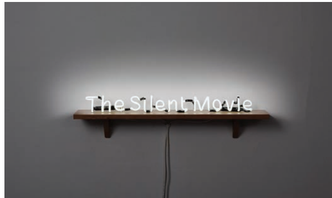
Laurent Grasso, The Silent Movie , 2010. © Laurent Grasso / ADAGP, Paris, 2012 photo : Florian Kleinfenn, permission de la Galerie chez Valentin, Paris