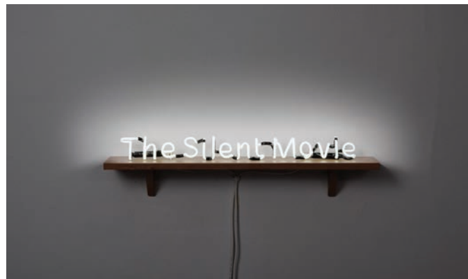
Laurent Grasso, The Silent Movie , 2010. © Laurent Grasso / ADAGP, Paris, 2012 photo : Florian Kleinfenn, permission de la Galerie chez Valentin, Paris