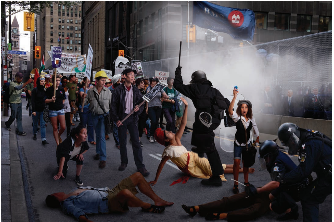
Carole Condé + Karl Beveridge, Liberty Lost (G20, Toronto) , 2010. photo : © Condé + Beveridge