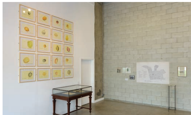
Vue d'exposition, Tropicomania : La vie sociale des plantes , Bétonsalon, Paris, 2012.