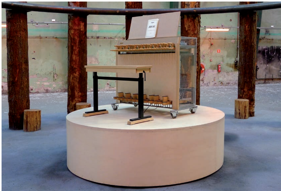
Sarkis, Ballads , vue d'installation | installation view, Submarine Wharf, Rotterdam, 2012. © Sarkis / SODRAC (2014) Photo: Wayne Cullen permission de l'artiste | courtesy of the artist