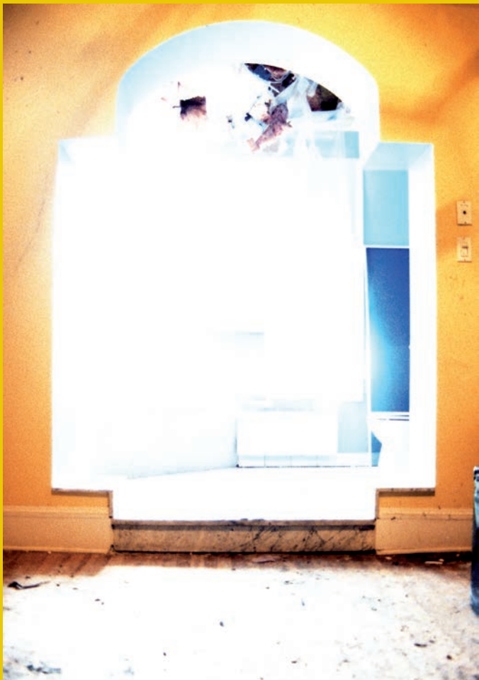
YANN POCREAU, SE PARTAGER L'ESPACE 08, 11 & 06, 2011. PHOTOS : © YANN POCREAU, PERMISSION DE | COURTESY OF GALERIE SIMON BLAIS, MONTREAL