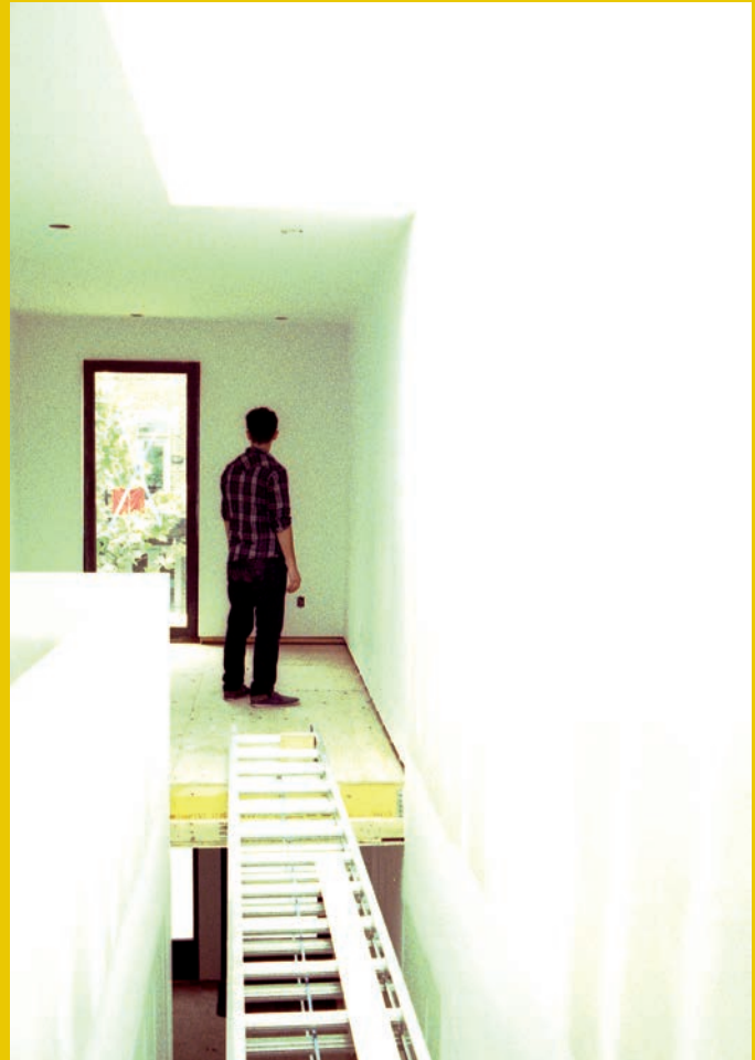
↑ YANN POCREAU, CHANTIER 07 & 06 , 2012. PHOTOS : © YANN POCREAU, PERMISSION DE | COURTESY OF GALERIE SIMON BLAIS, MONTREAL