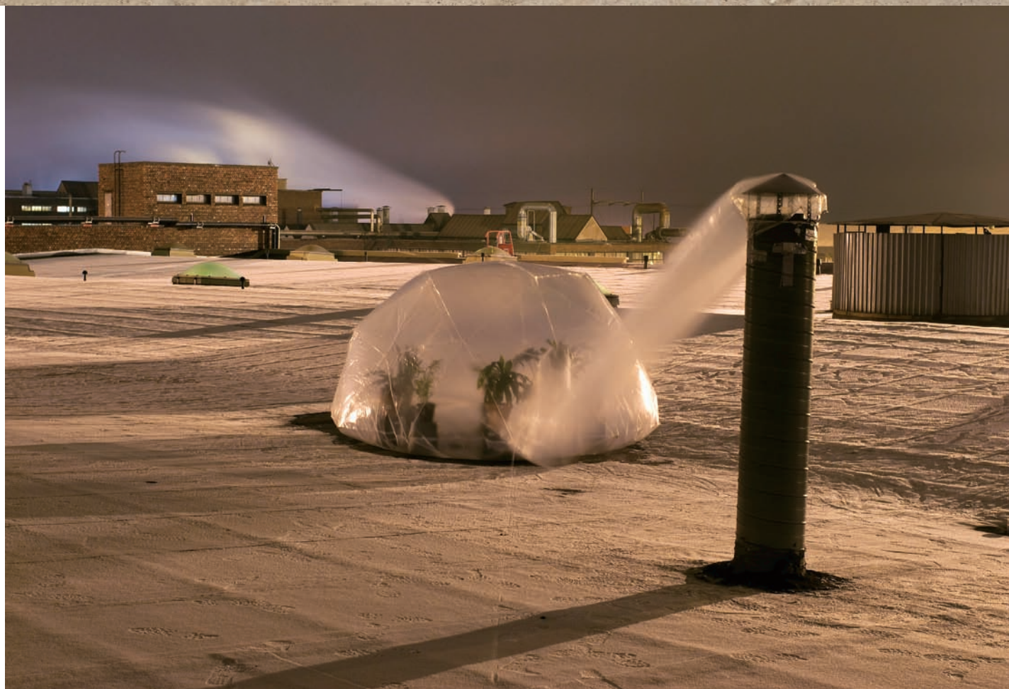
Ana REWAKOVICZ, Air Cleanser , 2008. Installation, plastique, plantes. 2 x 1,5 m. Pori, Finlande, Usine Rosenlew.