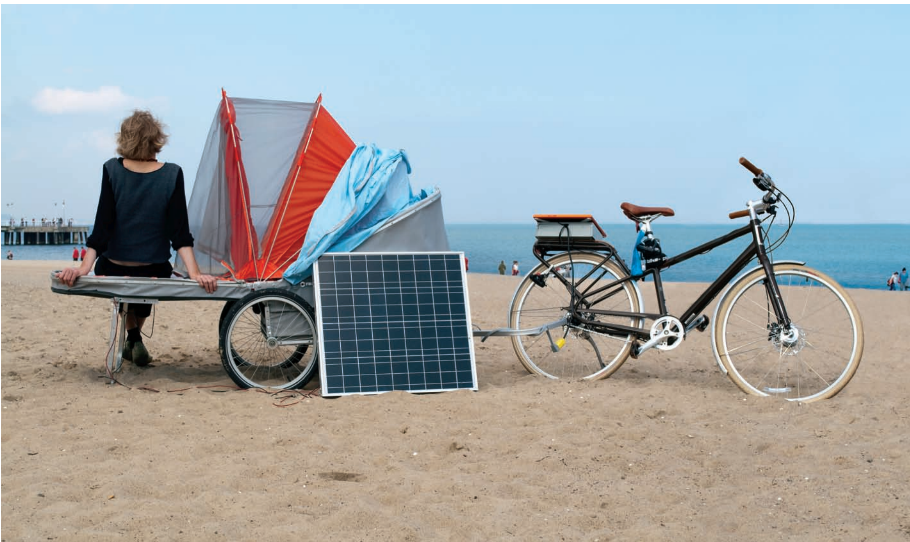
Ana REWAKOVICZ, SR-Hab ( Socially Responsive Habitat ), 2010. Prototype. Photomontage numérique. Finlande et Pologne.