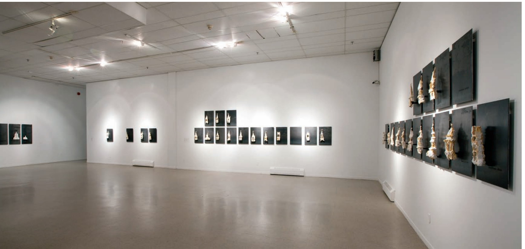
Pierre LEBLANC, Signes et repères , 2011. Série de 61 plaques. Acier bleui et plâtre sur une structure de métal. 60 x 40 cm (chacune).