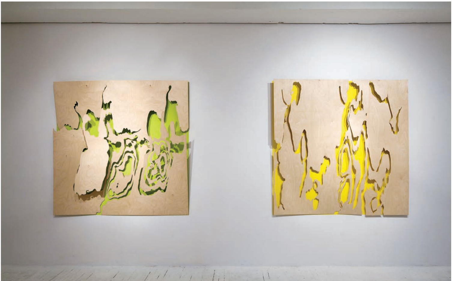
Élisabeth PICARD, Intervalle , 2010 et Brèche , 2010. Sculptures murales. Contre-plaqué et peinture au latex. 153 x 153 x 15 cm et 153 x 153 x 10 cm respectivement.