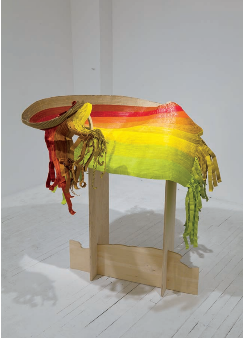
Élisabeth PICARD, Terminaisons chromatiques , 2010. Sculpture. Carton ondulé, peinture à l'acrylique et contre-plaqué. 124 x 112 x 102 cm. Photo: Guy L'HEUREUX. Avec l'aimable autorisation de l'artiste.