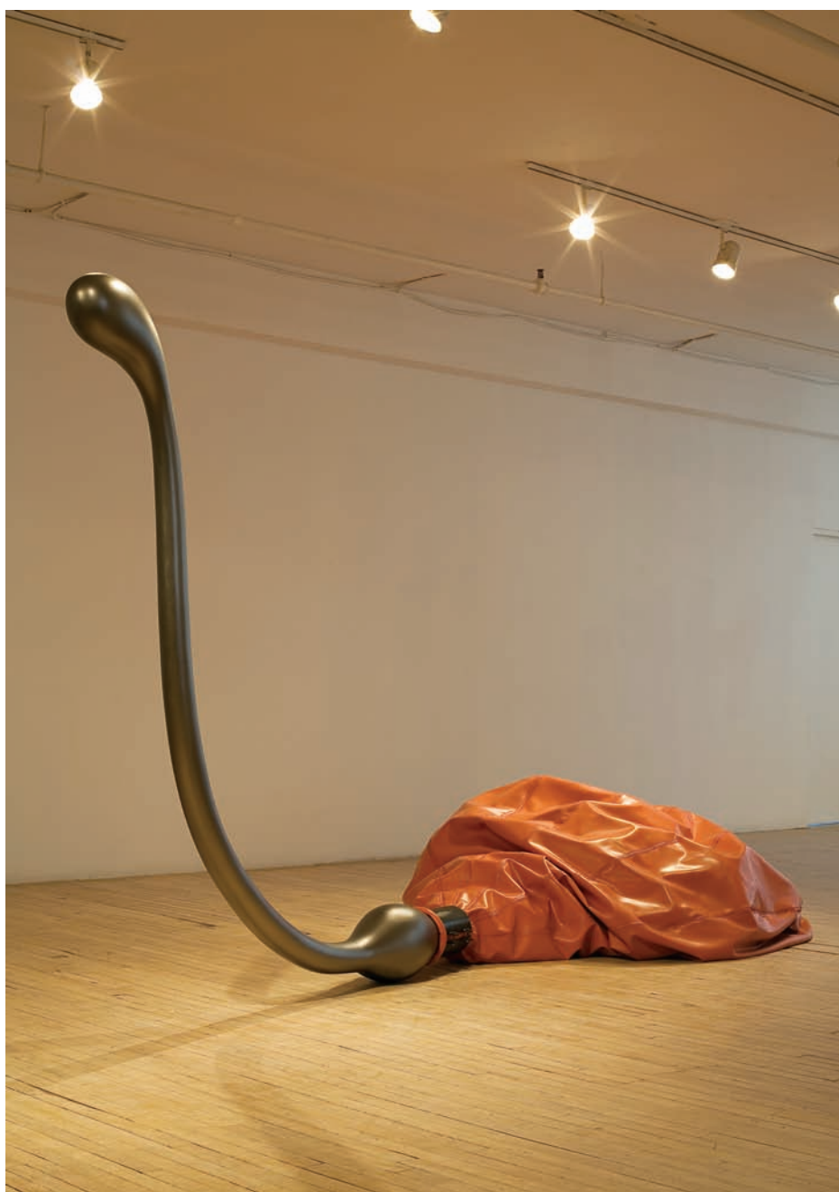
Liliana BEREZOWSKY, Cygnus , 2010. Sculpture. Caoutchouc, silicone, bois, graphite, acier. 199,5 x 425 x 160 cm (variable).