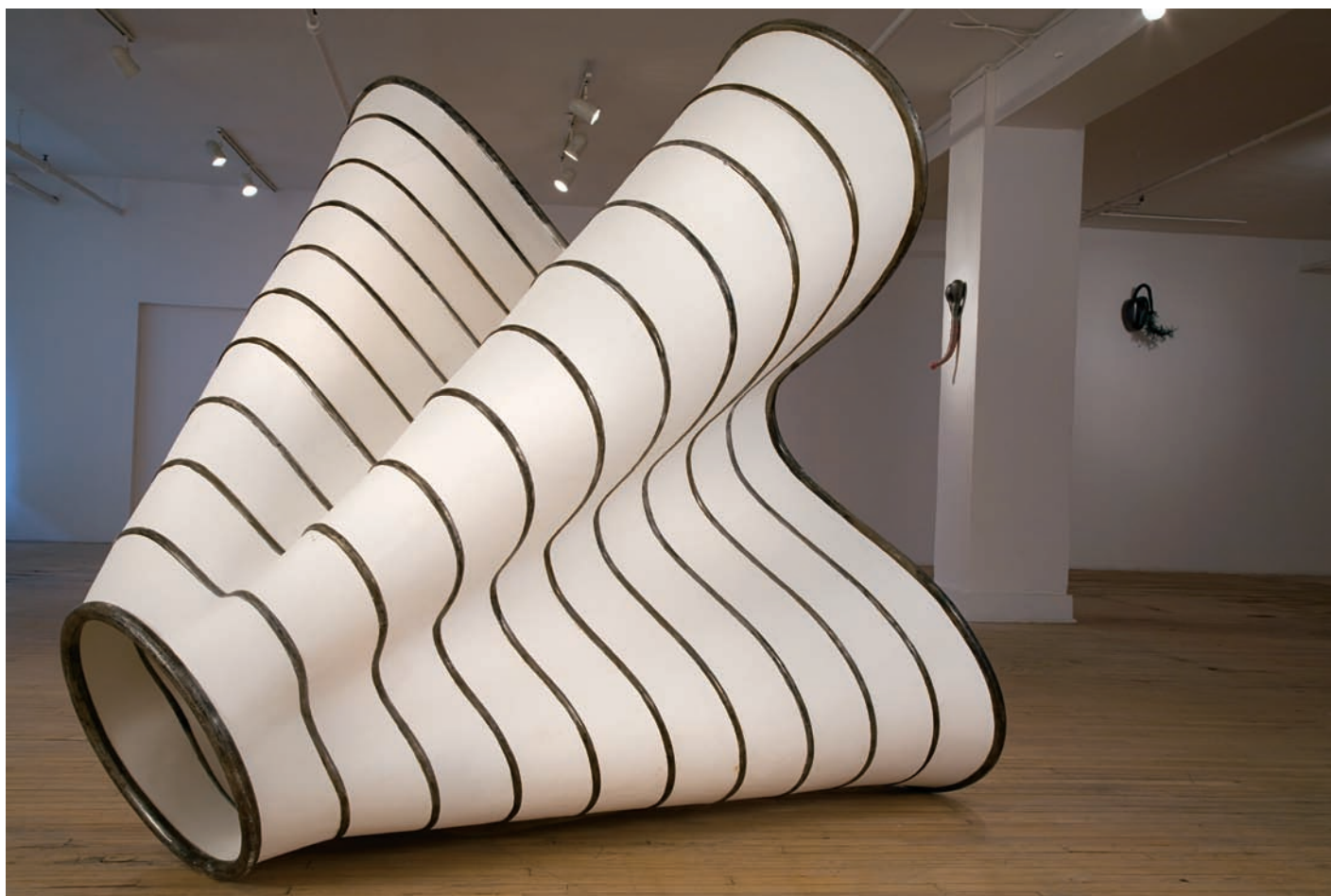
Liliana BEREZOWSKY, Marilyn's Skirt , 2010. Sculpture. Hydrocal et acier. 179,5 x 187,5 x 194 cm. Photo: Kevin BERTRAM. Avec l'aimable autorisation de l'artiste.

Élisabeth Picard, avec Terminaisons chromatiques , occupe l'autre salle des espaces de Circa. Si leur projet artistique se différencie, les deux artistes affichent une propension à la préoccupation du matériau. Toutefois, Picard choisit de le laisser s'exprimer de façon autonome, cependant en recourant à des sphères autres, mais afférentes à celles de l'art. On s'éloigne ici de la fonction autoréflexive de l'œuvre d'art, attitude prévalant à l'intérieur des schèmes de la postmodernité. Cette artiste choisit plutôt de constater des faits scientifiques–géographiques et