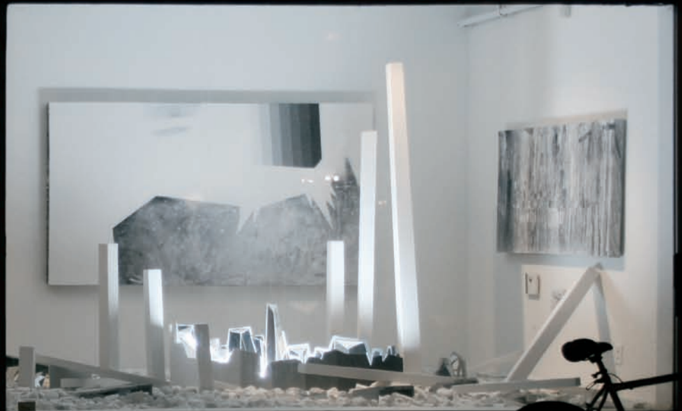
Simon BILODEAU, À la fin de l'arc-en-ciel / At the End of the Rainbow, 2010. Installation. Tech- niques mixtes / Mixed media. 152 x 426 x 274 cm. Vitrine/Shop window, Galerie Art Mûr.

terrain, et où le désir de faire un produit reconnaissable par la constitution d'une marque, d'un branding 4 (de haut niveau), d'un nom occupe la scène.