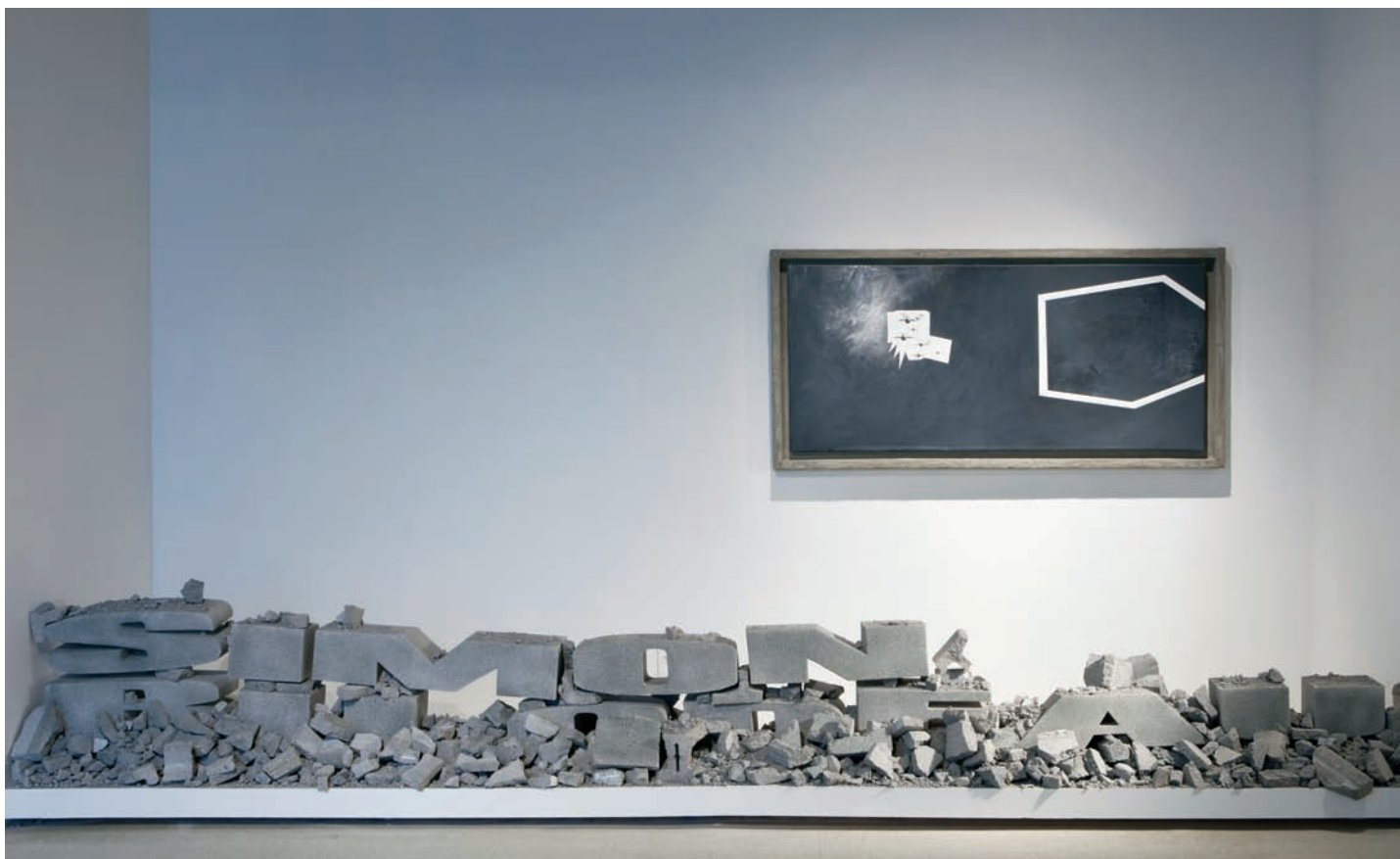
Simon BILODEAU, SimonBilodeau 1 ; Un futur parfait , 2009. Œuvres faisant partie de l'installation Tu n'es qu'une étoile . Sculpture : 450 x 76 x 31 cm ; tableau/ painting : 80,5 x 166 cm. Techniques mixtes et acrylique sur toile/Mixed media and acrylic on canvas.