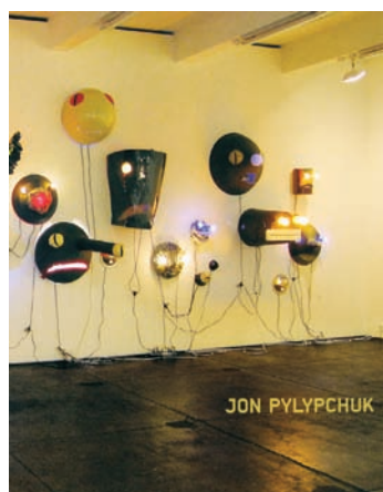
François LÉTOURNEUX, Jon Pylypchuk , © Musée d'art contemporain de Montréal, 2010, 39 pages. www.macm.org

Le catalogue bilingue accompagnait l'exposition qui s'est tenue au Musée du 8 octobre 2010 au 2 janvier 2011. «Œuvrant, écrit le commissaire François Létourneau, à partir de matériaux pauvres, trouvés ou achetés à bas prix (fausse fourrure, bois, tissu, tôle, cannettes de bière, ampoules électriques, mousse de polyuréthane, etc.), Jon Pylypchuk réactualise les pratiques du collage et du bricolage dérivées de l'art brut et moderne.»