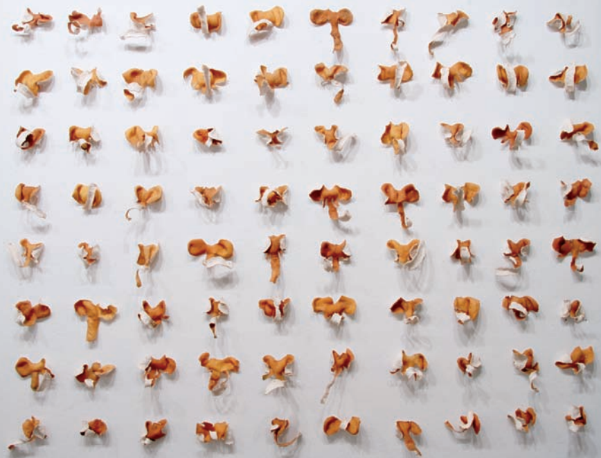
Angie HOSTETLER, Orange elephant (now we're friends) , 2009. Pelures d'oranges. Dimensions variables.