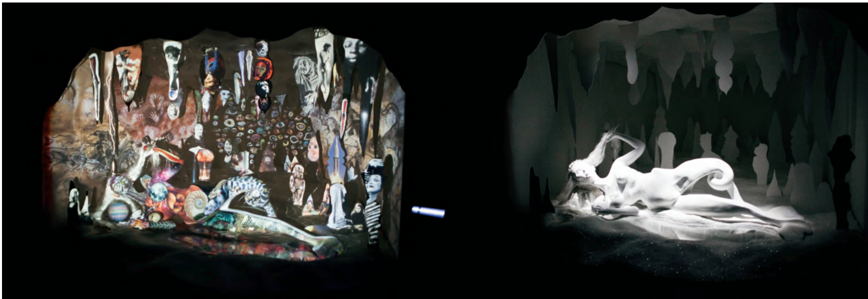
Shary BOYLE, Bridge and Chorus/Pont et chœur , 2012. Porcelaine, vernis, glaçure, table tournante d'époque, disque en vinyle, commande de minuterie. 51 x 46 x 46 cm.