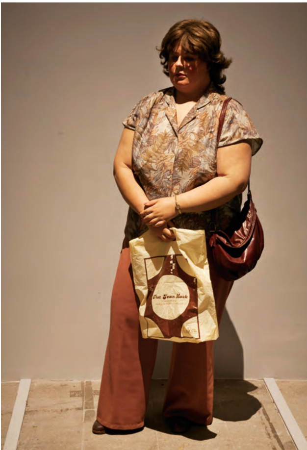
Duane HANSON , Bus Stop Lady , 1983. Polyvinyle peint à l'huile, matériaux mixtes avec accessoires.