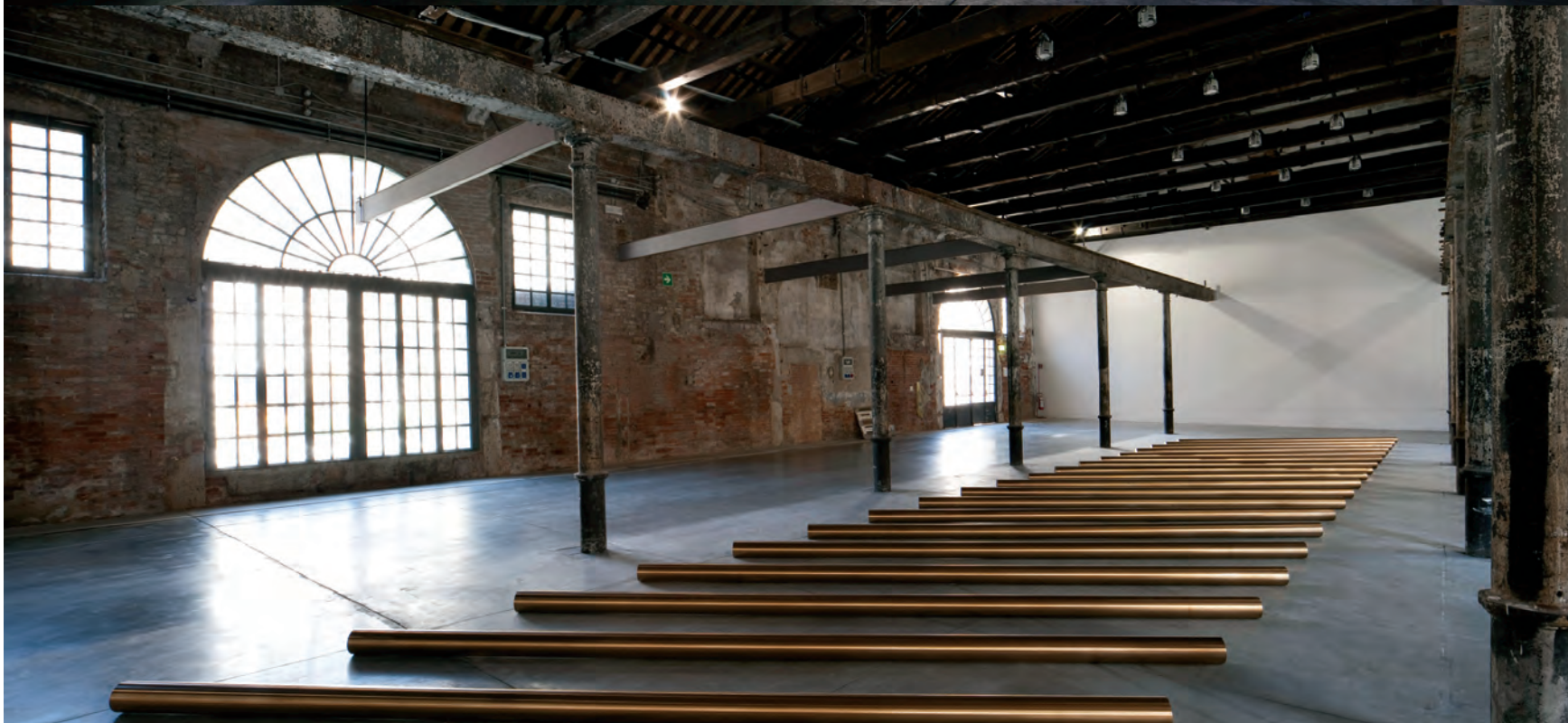
↑ Bruce NAUMAN, Raw Material with Continuous Shift—MMMM , 1991. L'Arsenale.