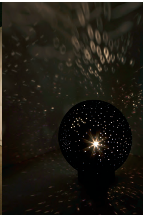
Matt MULLICAN, Untitled (learning from the Person's Work) , 2005. L'Arsenale. Photo: Francesco GALLI. Avec l'aimable autorisation de la Biennale de Venise.