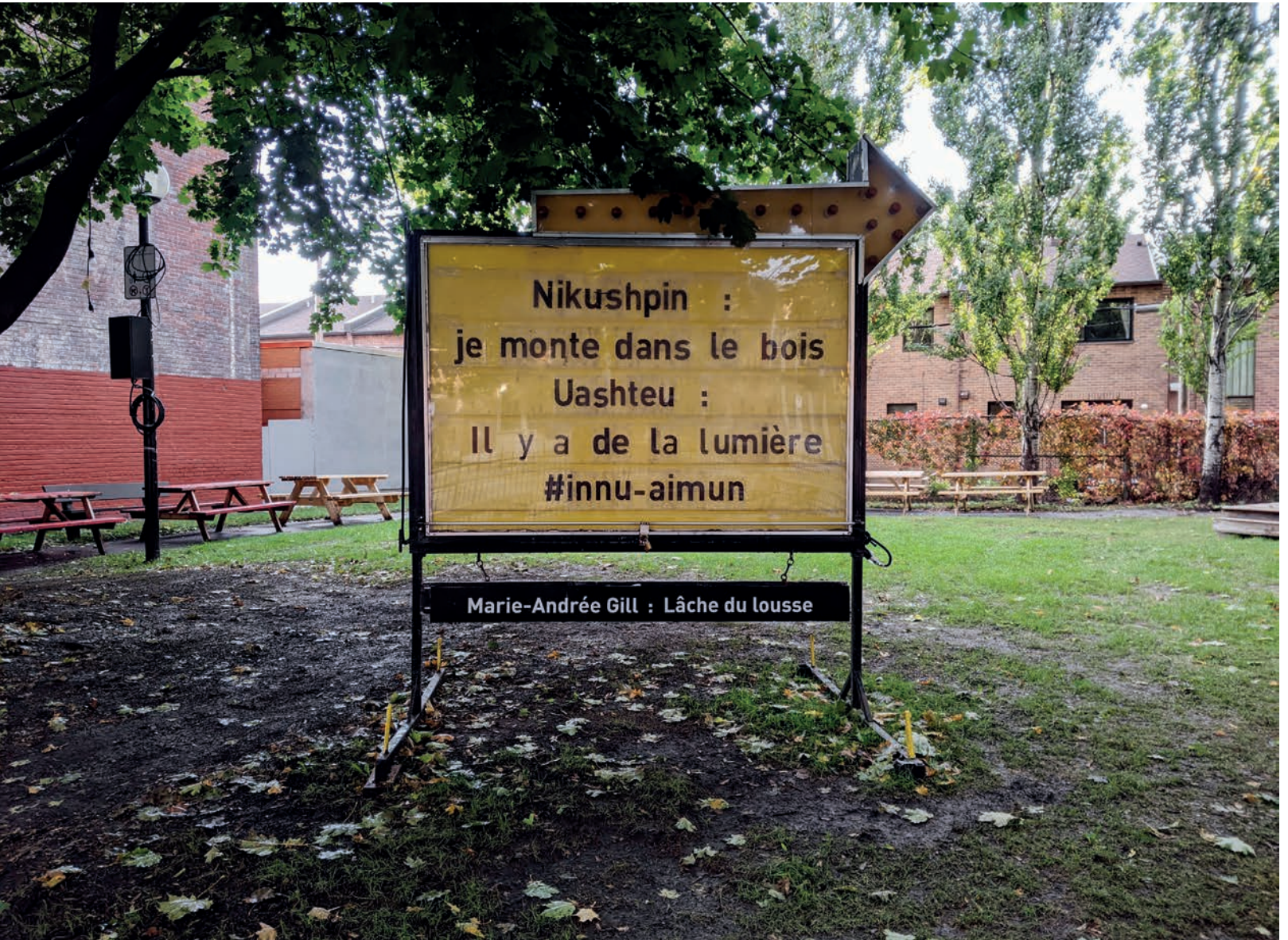
Marie-Andrée Gill, Lâche du lousse , 7-13 octobre 2020.