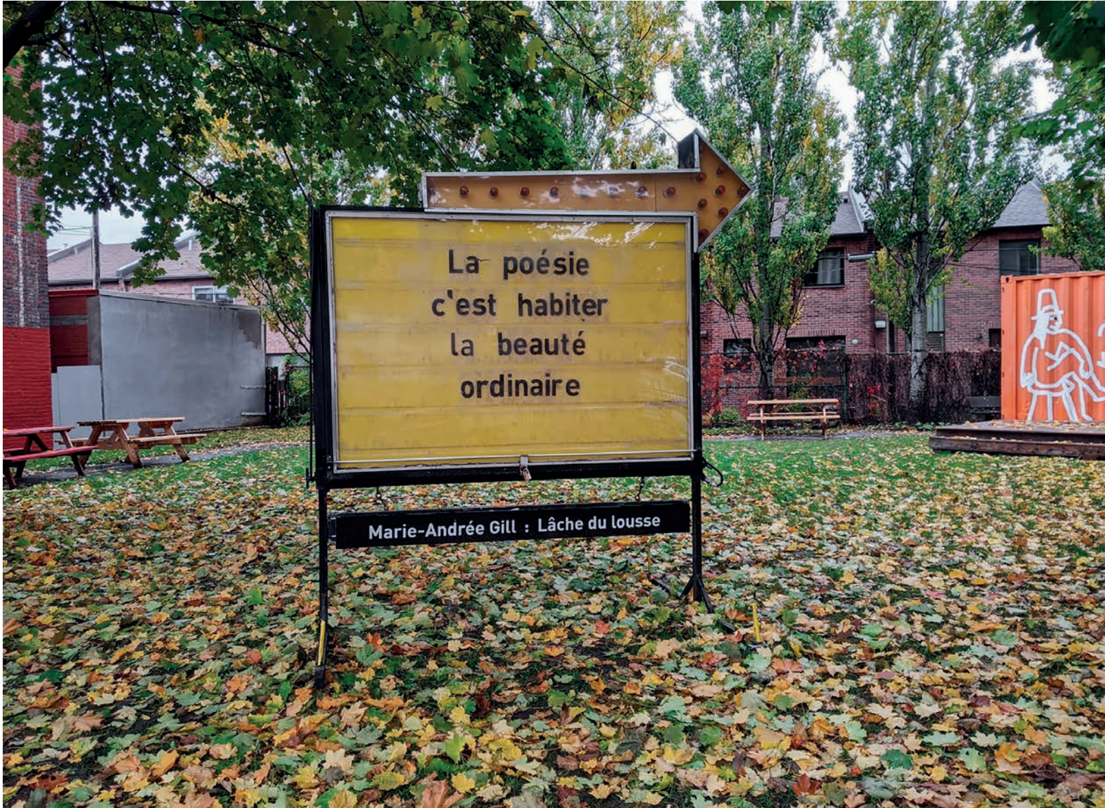
Marie-Andrée Gill, Lâche du lousse , 14-20 octobre 2020.