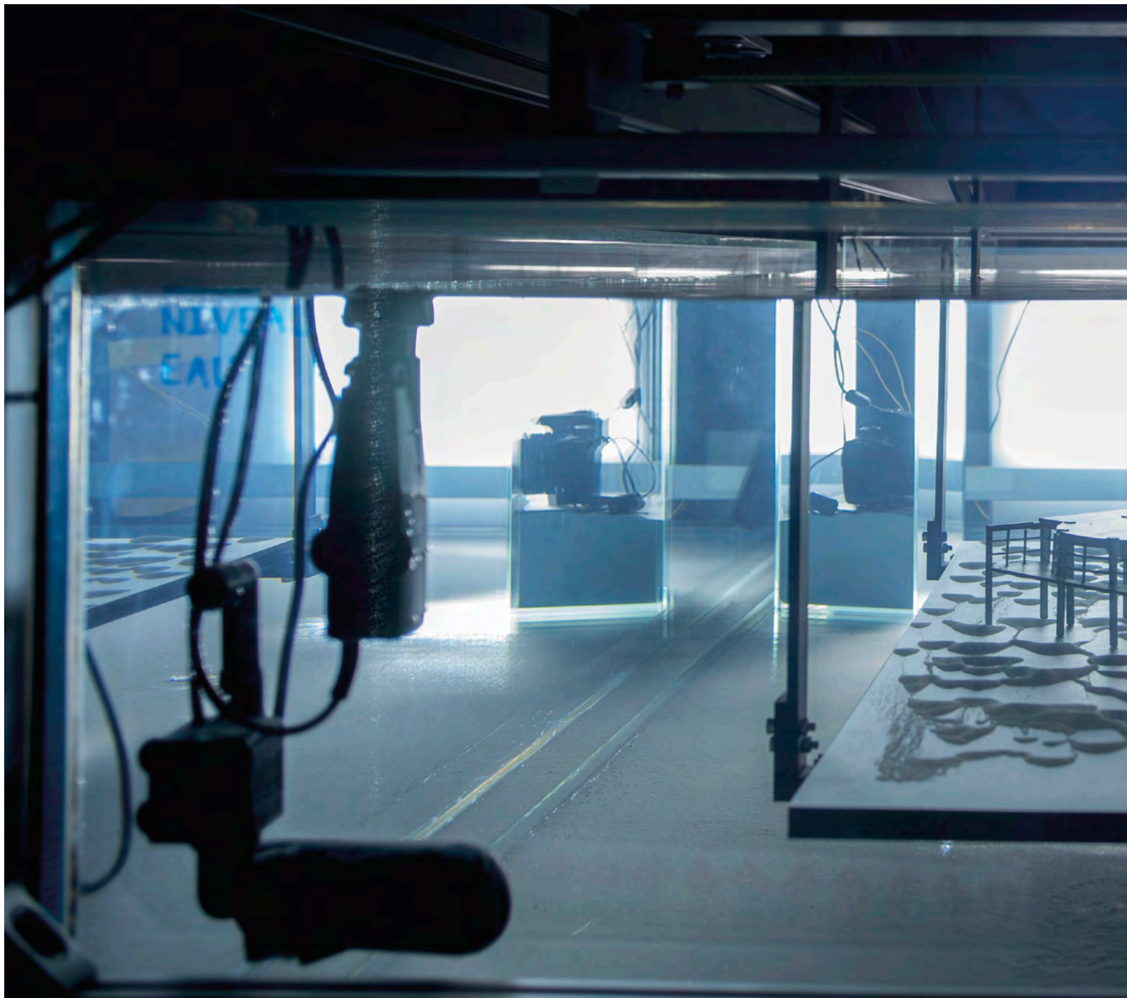
Hicham Berrada & Sylvain Courrech Dupont & Simon de Dreuille, Infragilis , 2017. Machine, maquette et vidéo, verre, eau, mouvement, sable, maquette en laiton, administration à distance. Vue de l'exposition, Palais de Tokyo. © ADAGP/Hicham Berrada. Avec l'aimable permission de l'artiste et kamel mennour, Paris/Londres. Photo : Hicham Berrada.

appréhende le monde comme une atmosphère animée de forces magnétiques, de conditions climatiques instables, de particules qui se contaminent et se dissolvent dans de plus larges fluides. Dans un climat nocturne, la série Présages , initiée en 2007, révèle des cataclysmes, des filaments, des excroissances et des concrétions colorées par l'oxydation rouge du fer, bleutée du cobalt et verte du cuivre; une pléthore de mondes chimériques où la domination de l'homme sur les autres règnes n'aurait plus cours. La matière, sublimée par les cadres et la lumière, devient comme un immense organisme. L'artiste met en scène la recréation artificielle du vivant, les mouvements chaotiques d'une nature activée chimiquement ou mécaniquement bien qu'il s'agisse d'un microcosme complètement minéral, floutant la frontière entre le vivant et l'inerte. Les formes s'émancipent