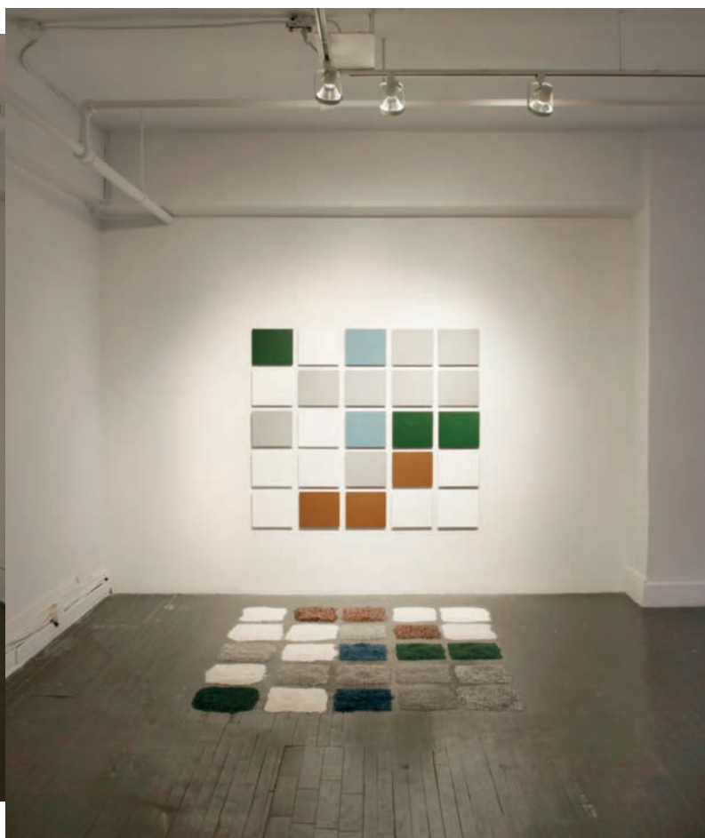
Simon GRENIER-POIRIER, Le temps d'eaage est une peinture , 2012. Installation. 160 x 355,6 cm.