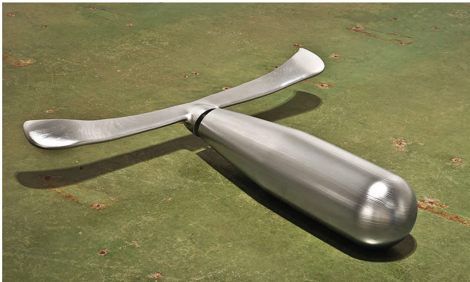
Bernard-Alexandre BEULLAC, La Parabole matérielle III , 2010. Bois peint. 20 x 100 x 87 cm.

La matière, elle aussi, participe à la subjectivisation des sculptures. On peut remarquer des marques d'imperfections sur Rose — œuvre qui fait formellement référence à la bombe lancée sur Hiroshima. L'artiste semble accepter ces marques de travail, comme le ferait un artisan. De la même manière, sur beaucoup de ses œuvres apparaissent des coulures de peinture. Par ces empreintes, l'homme peut se reconnaître, contrairement à ce qu'offrent les produits industrialisés. Quant à La Parabole matérielle II et III , la matière contribue à rendre l'œuvre plus ambivalente encore. Réalisées en bois, elles sont recouvertes d'une couche de peinture métallique.