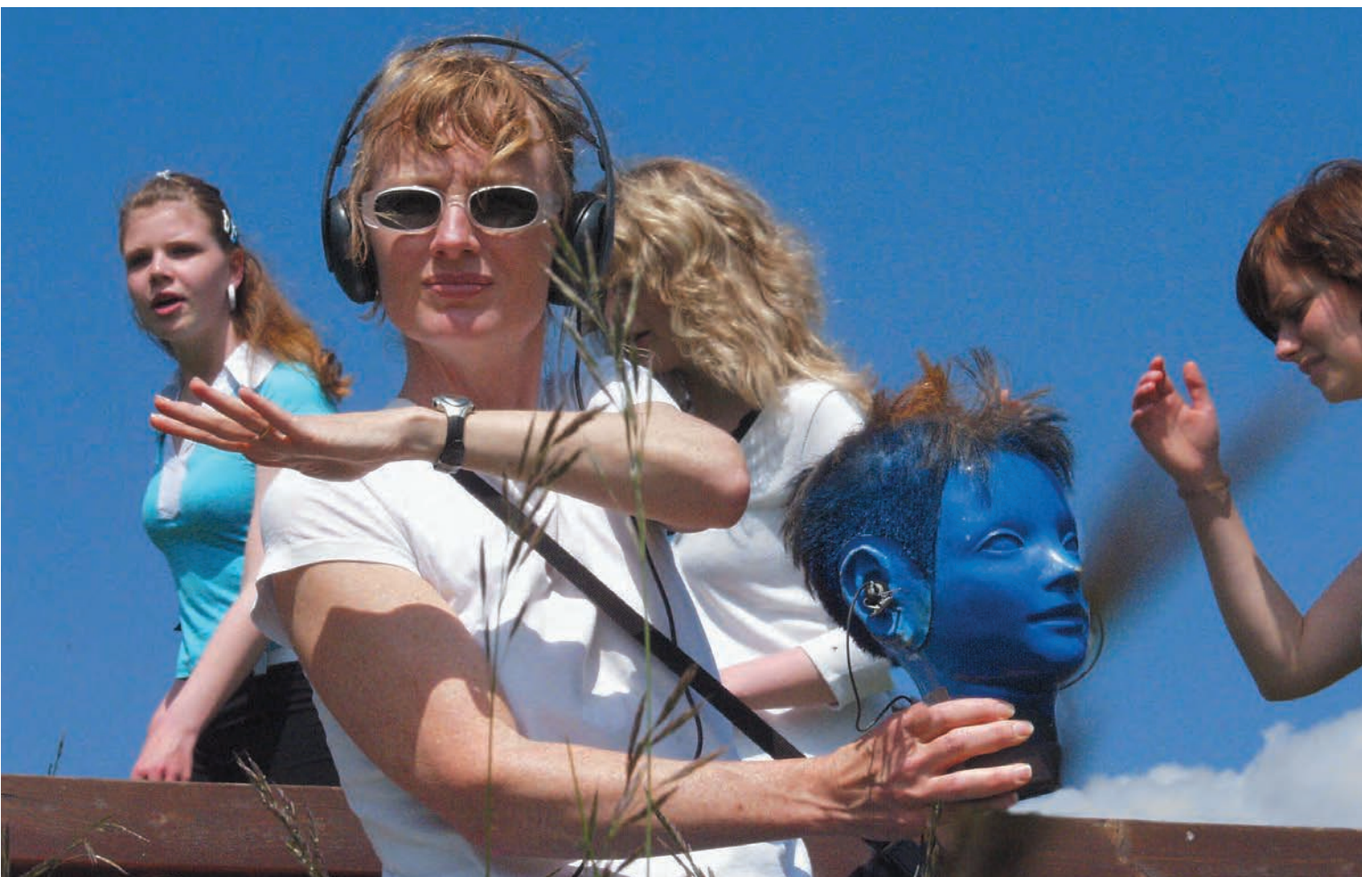
Janet CARDIFF & George BURES MILLER, Jena Walk (Memory Field) , 2006. Commandé par le Culture Department de la Ville de Jena, Allemagne/Commissioned by the Culture Department of the City of Jena, Germany.

Beyond media overkill, the political dimension of public art also raises questions regarding the methods of selecting work, notably the highly