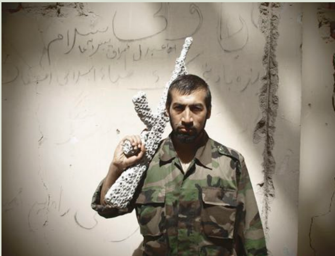
Emeric Lhuisset , War pictures , photographies d'un combattant afghan armé d'une Kalachnikov en jouet recouverte de broderies ornementales kandahari (miroir et fil d'argent), 2010.

Pour cette exposition qui a débuté à Bandjoun Station, le 17 novembre dernier, et qui se poursuivra toute une année, vous avez rassemblé les œuvres de 23 artistes africains et européens, et invité deux performeurs, dont la plupart sont internationalement connus. En quoi les œuvres choisies suggèrent-elles « ce décalage sensible » entre le Game et le Play ?