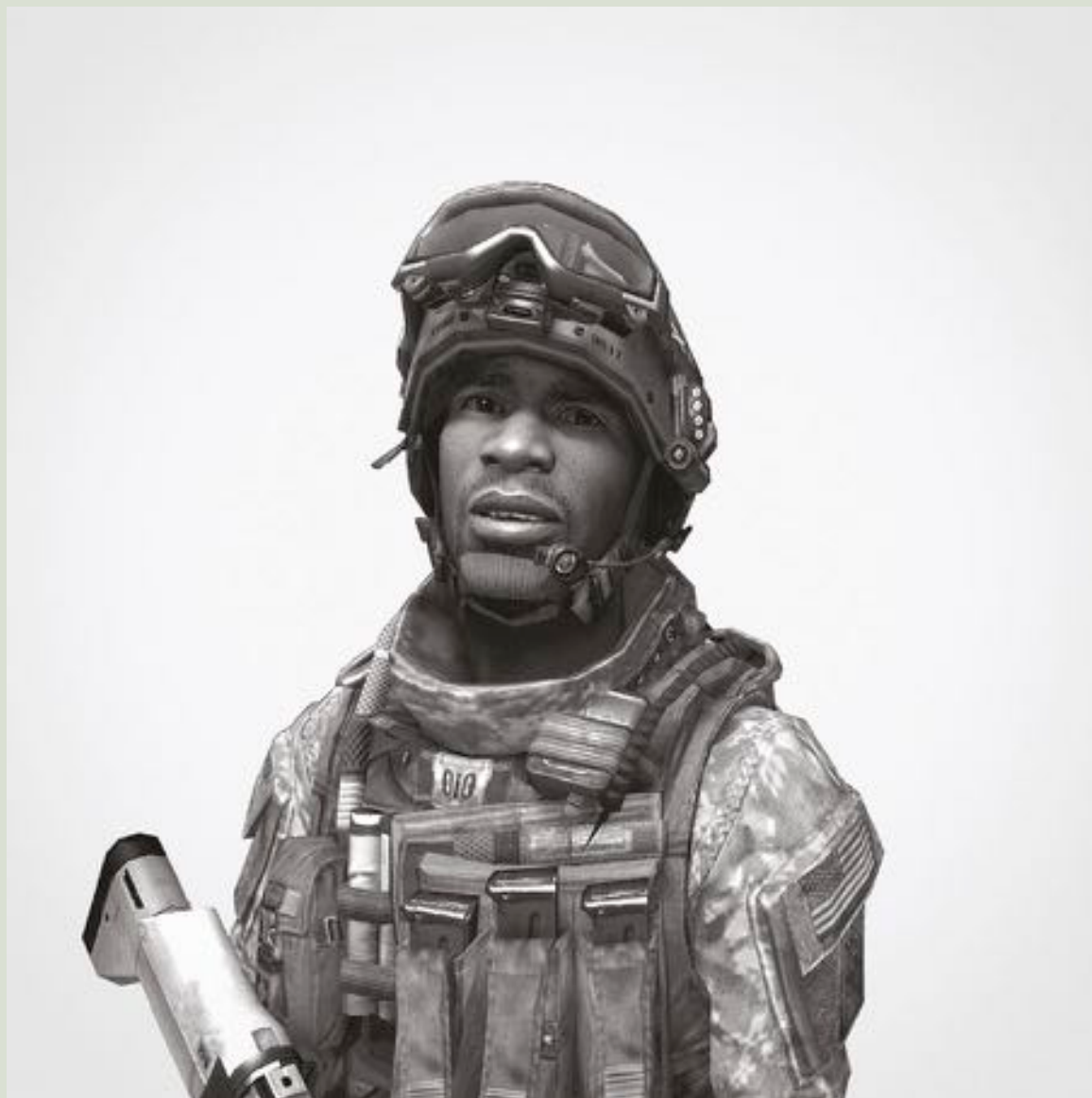
Thibault Brunet , First Person Shooter, Pvt Casey , 2011. Impression dos bleu, 50 x 50 cm.