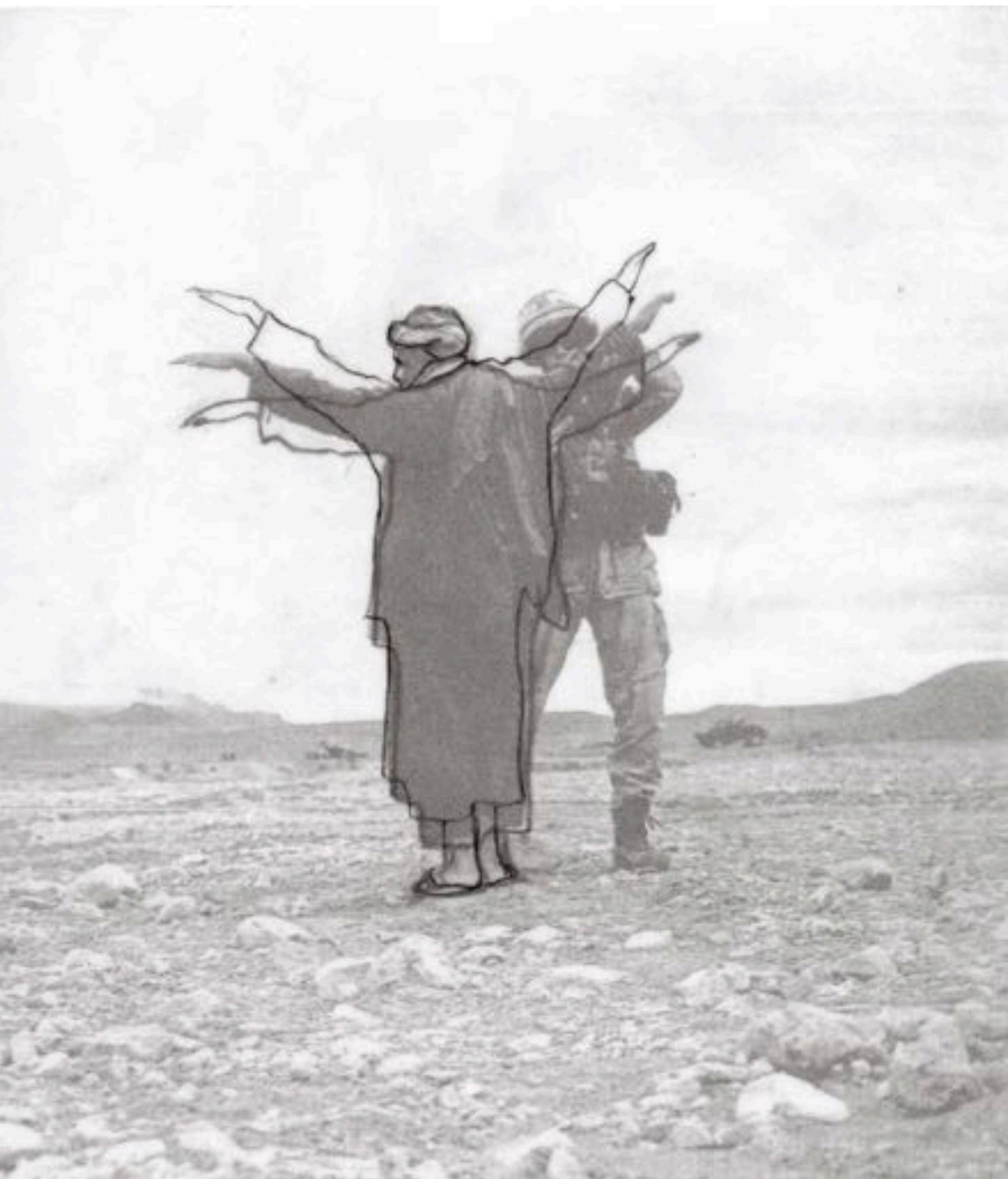
Massinissa Selmani , Teyara , 2010. Tirage en encre pigmentaire sur papier, 21 x 18,5 cm. Avec l'aimable permission de l'artiste.