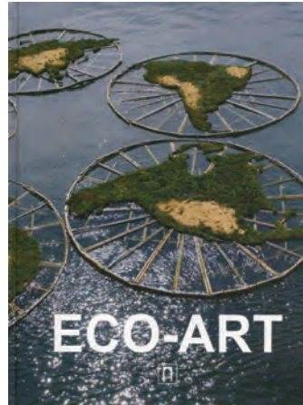
Eco-Art . © Pori Art Museum 2011. 221 pages. www.poriartmuseum.fi