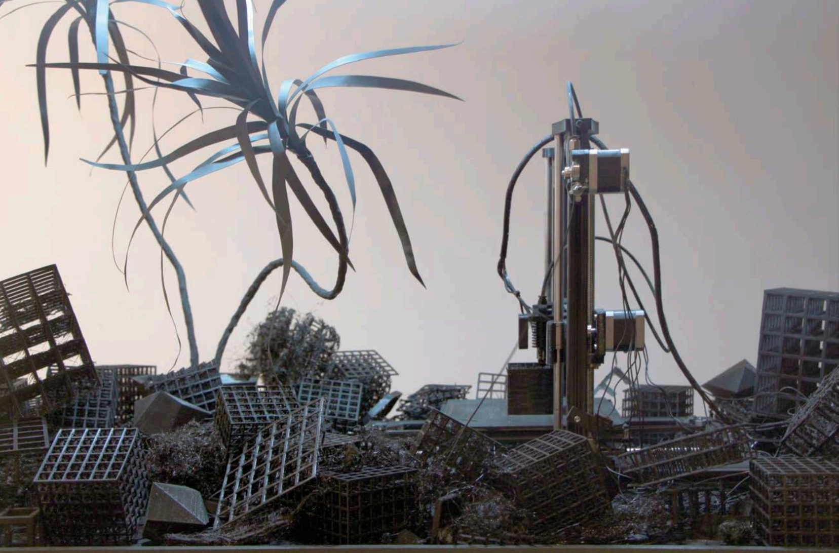
P. 36-37 : Simon Bilodeau , De l'avant comme avant , 2016. Vue partielle de l'exposition/Partial view of the exhibition.