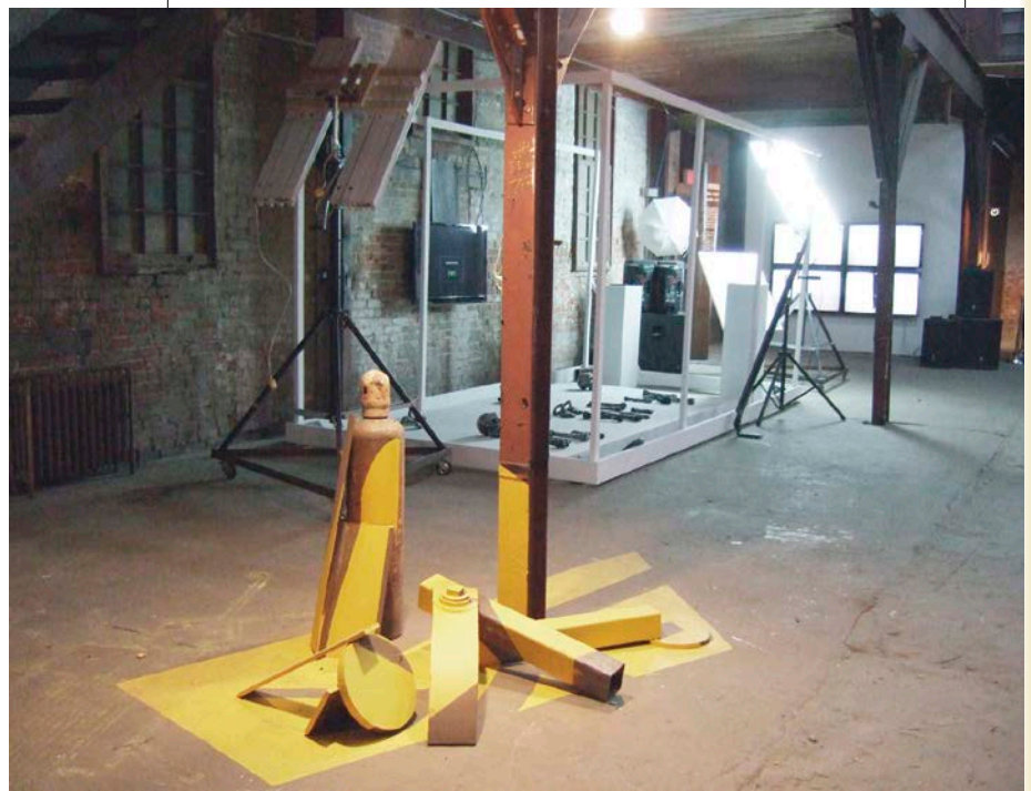
Vue de l'exposition, 2014.

Chantier libre 4 entend redéfinir le champ de la sculpture à partir de cette polysémie de formes. L'ensemble se place sous le règne du multiple et de l'hétéroclite d'où l'objet émerge et vient occuper une place centrale. La prépondérance de l'objet donne une inflexion résolument formaliste à l'exposition : elle se compose au plus près de l'objet et de sa matérialité, où s'expérimentent différentes formes et de nombreuses manipulations. La thématique fixe lui faisant défaut, l'exposition garde nécessairement une approche formelle qui laisse peu de perspective critique.