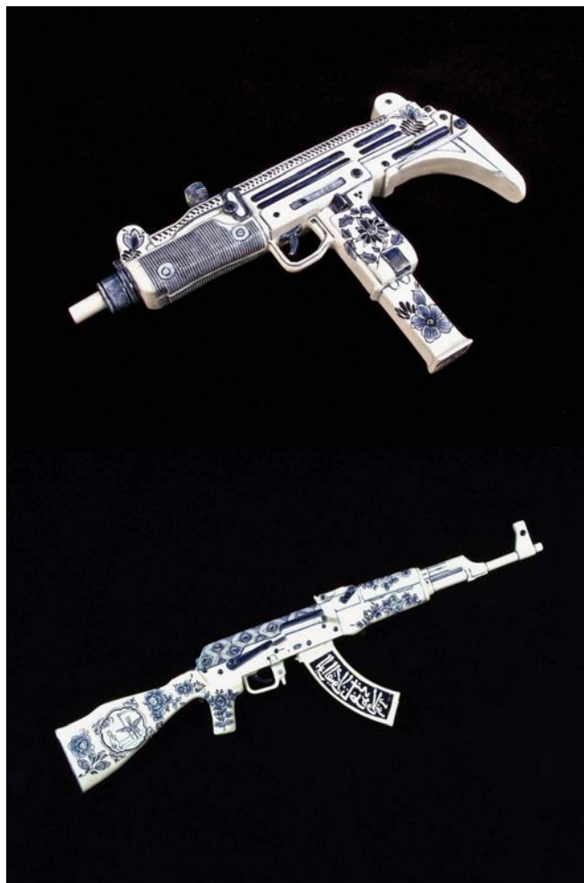
Charles Krafft, haut/top : Porcelain War Museum Project: Large Uzi, 2012. Bas/Below : Porcelain War Museum Project: Saul Steinberg Ak47, 2013. Pâte de porcelaine molle peinte à la main/Hand painted soft paste porcelain. Grandeur nature/Life-sized.

Là où la sculpture est revisitée, ce n'est pas tant dans l'utilisation à contresens de la pierre, mais bien dans le choix de l'objet à fabriquer. L'industrialisation nord-américaine de la fin du 19 e siècle – concordant avec la révolution militaire qui marque considérablement la technique