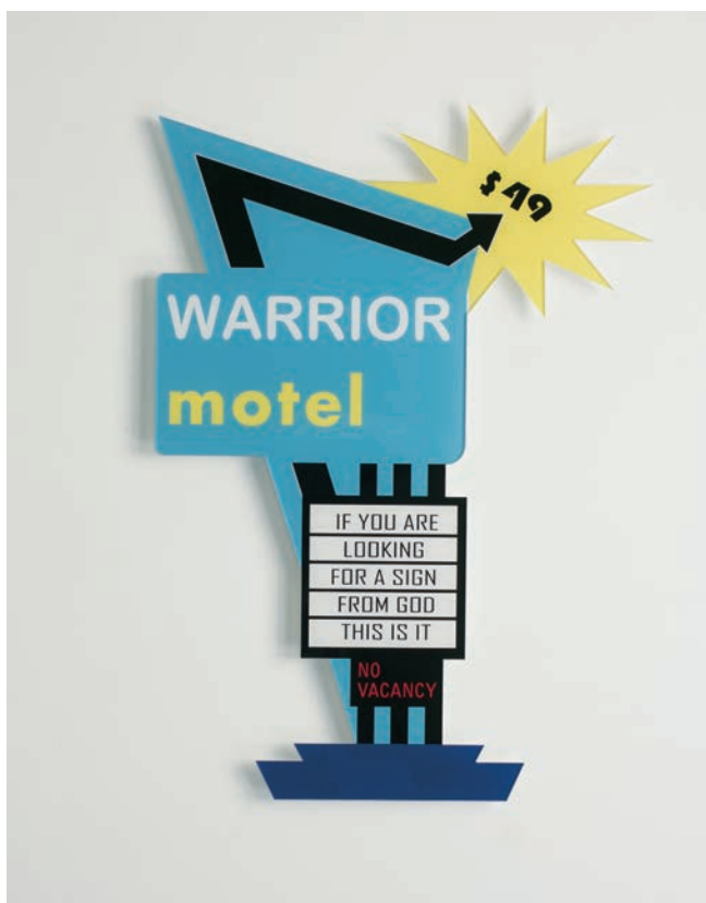
Whitney HORNE, WARRIOR motel , 2012. Bois, peinture, plexi- glas/MDF wood, paint, Plexiglass. 74 x 53 x 1,9 cm.