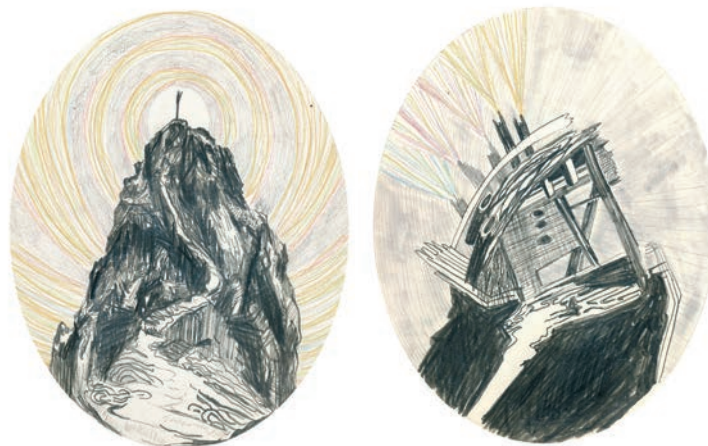
Amélie Laurence FORTIN, Caltras & Notus , 2012. Divers crayons sur papier/Various pencils on paper. 17 x 11 cm encadré- framed. Détail de Hawaï.