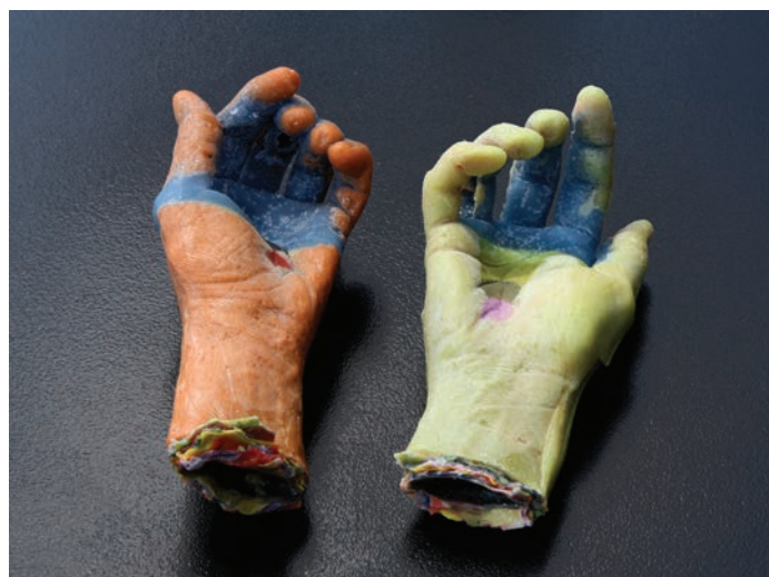
Amélie Laurence FORTIN, Les mains de James Cook , 2012. Cire colorée/Colored wax. 13 x 25 cm.