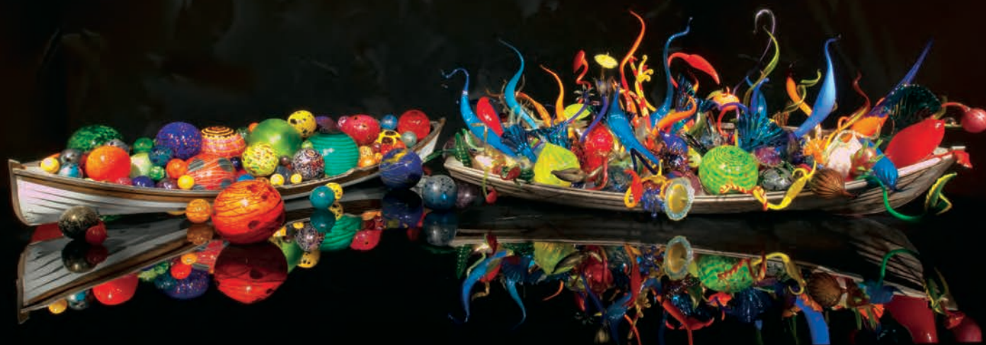
Dale CHIHULY, Mille Fiori , 2008. 2,9 x 17,1 x 3,7 m.

entre autres Venise et Jérusalem, ainsi réaménagés en carrefours trans-temporels et transculturels où, pour le temps de leur exposition, les lustres chatoyants et voluptueux ravivent plus qu'ils ne contredisent l'architecture marquée par l'usure.