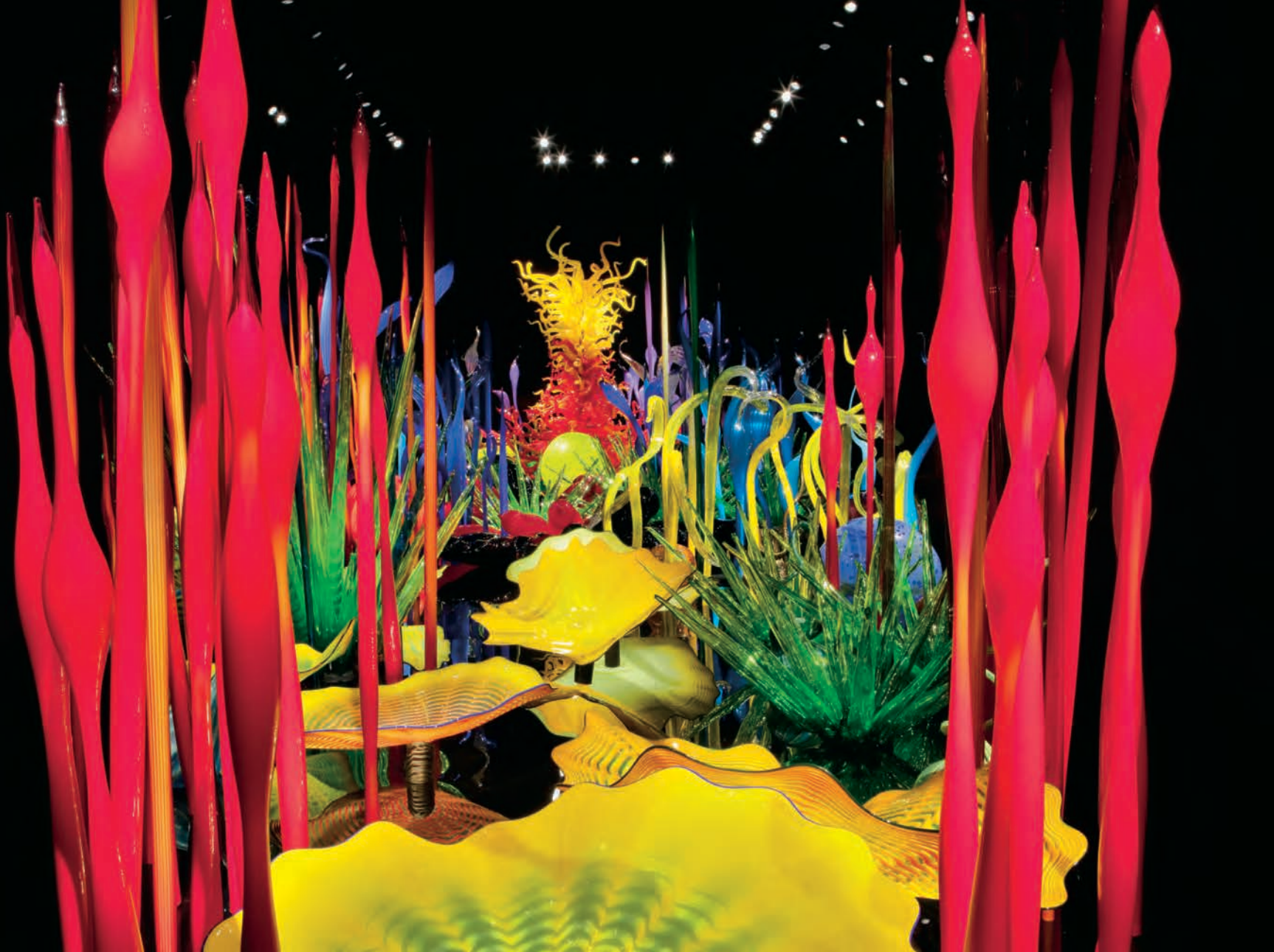
Dale CHIHULY, Mille Fiori , 2008. 2,9 x 17,1 x 3,7 m.

Toutes ces accusations qui reconduisent le mythe romantique de l'artiste authentique sensé s'épanouir dans la misère sont en somme assez inconséquentes par comparaison au regard sévère porté sur ses œuvres. Par exemple, en 2011, le lauréat du prestigieux Pulitzer Price pour la critique en histoire de l'art aux États-Unis, Sebastien Smee 7 , au demeurant peu intéressé à la réputation sulfureuse de Chihuly, emploie des termes très durs à l'égard de son travail : « absence de concept », « manque de profondeur et de retenue » et, pis encore, « de mauvais goût ». Aussi bien en rajouter : kitch, tape-à-l'œil et bling-bling. C'est dire que la surabondance de formes et de couleurs peut heurter plus que séduire. Or, Smee le reconnaît, le « goût » est une affaire de codes de réception variables, fondés sur des a priori de divers ordres. À défaut de pouvoir ici creuser la question des changements d'attitude à travers les temps, il suffit de souligner qu'après des décennies d'éloge, le « spectaculaire » a peut-être atteint son point de saturation 8 .