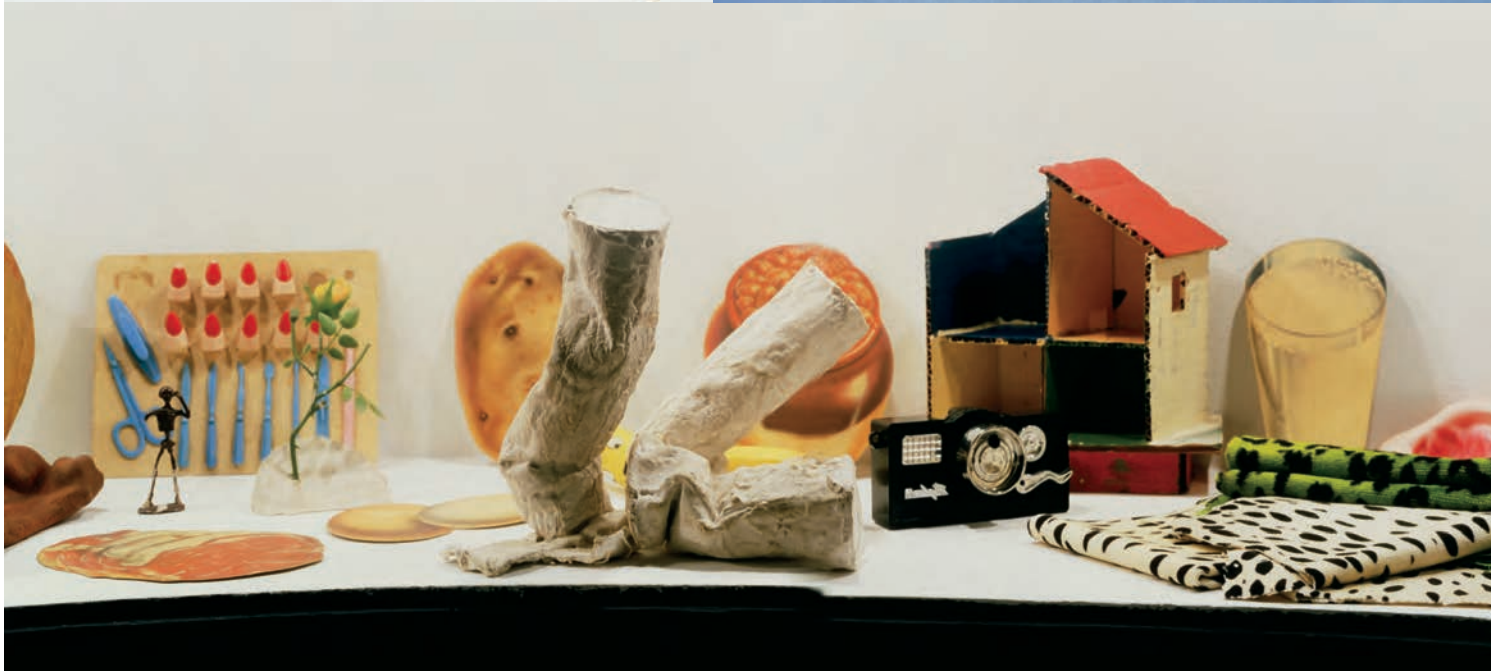
← ← Claes OLDENBURG , Mouse Museum , 1965-1977. Bois et aluminium ondulé, présentoirs en plexiglas avec 385 objets, son/Wood and corrugated aluminum, plexiglas display cases with 385 objects, sound. 2,6 x 9,5 x 1,0 m. Collection Museum Moderner Kunst, Stiftung Ludwig Vienna, Autriche/Austria. Prêté par/On loan from the Austrian Ludwig Foundation. Copyright 1965-1977 Claes Oldenburg.