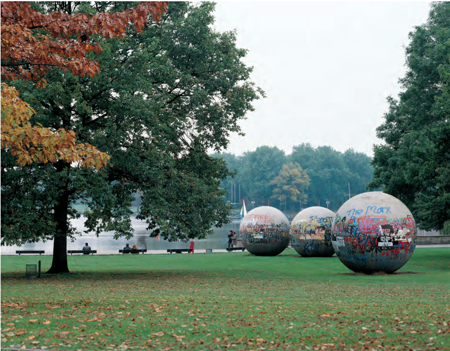
Claes OLDENBURG & Coosje VAN BRUGGEN, Pool Balls , 1977. Béton armé/Reinforced concrete. 3.5 m diam. ch/ea. Collection Aaseeterrassen, Münster, Germany. Copyright 1977 Claes Oldenburg and Coosje van Bruggen.