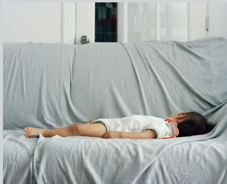
Shaore Lies on Futon , 2011, inkjet print, 101,6 x 127 cm

— James D. Campbell is a writer on art and independent curator based in Montreal. The author of over 100 books and catalogues on contemporary art and artists, he contributes frequently to visual arts publications across Canada and abroad. —