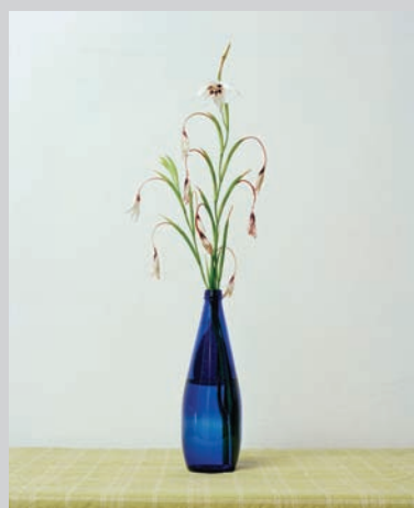
Blue Bottle , 2011, inkjet print, 101,6 x 81,3 cm