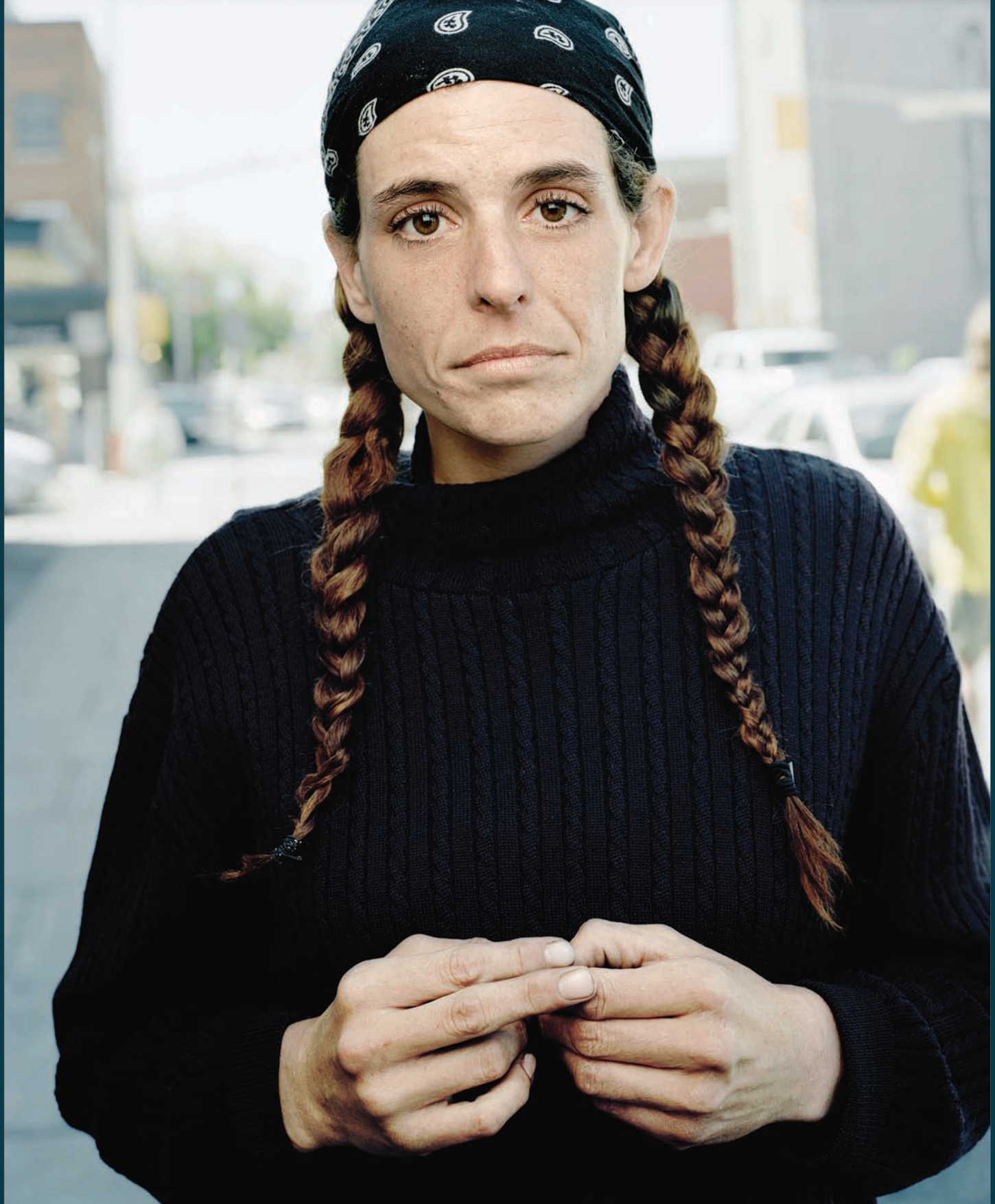
Tony Fouhse USER Portraits of Crack Addicts