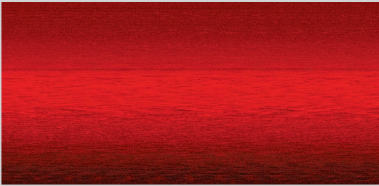
Failed , 2008, boîte lumineuse aux LEDs, 122 x 244 cm