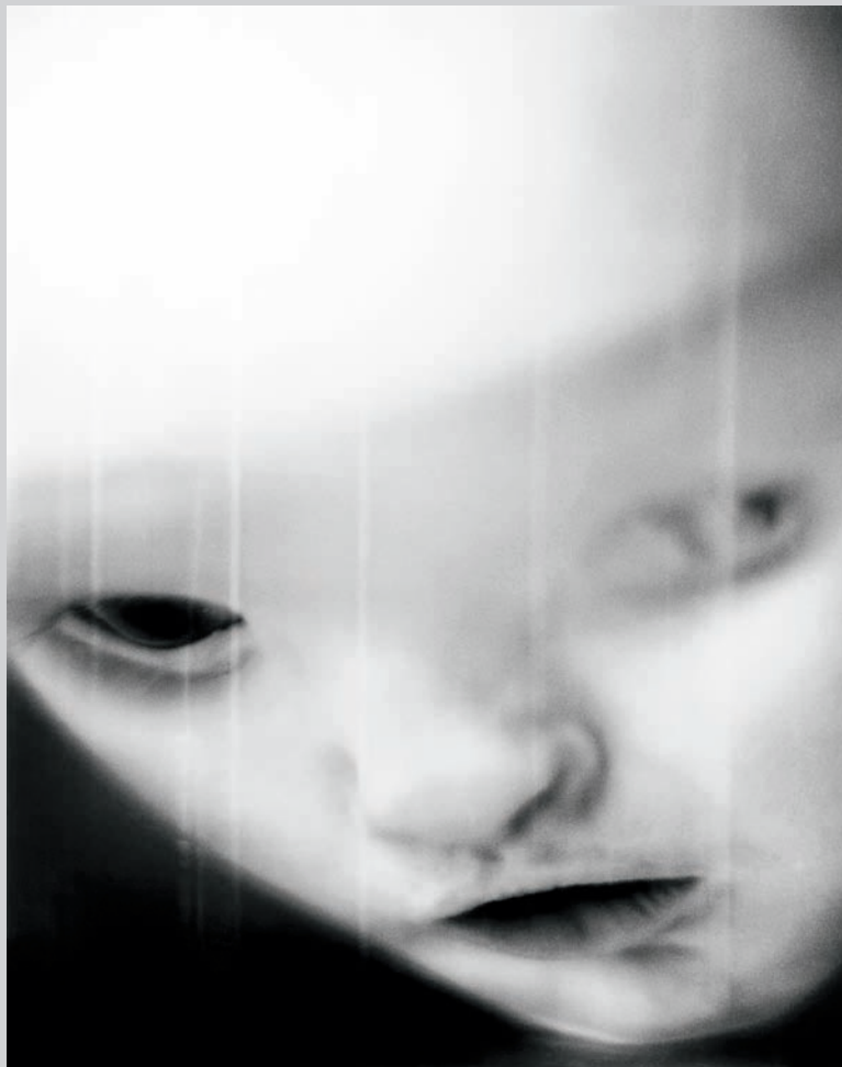
Lena Herzog , Untitled # 5 , Narrenturm, Vienna, Austria, 2007, gelatin silver print, 56 x 71 cm

The first room contains the work of Hong-An Truong. Her multi-perspective video montage Adaptation Fever (2006–07) is made up of found black-and-white film footage from Indochina. Images are fragmented, cut off, and sometimes mirrored against one another. Viewers quickly become aware of the flatness of photography as images fold into themselves like filmic origami. Footage is sped up, and we only briefly glimpse prosaic scenes such as a young child reaching up to grasp the cross hanging around a priest's neck. Other scenes include a boxing match, a burning car, a group of can-can dancers, and a