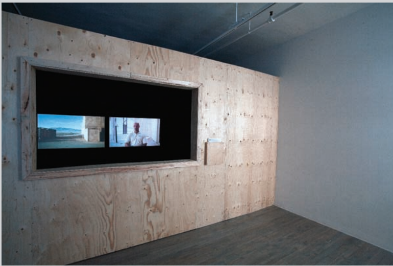
Emanuel Licha, vue d'exposition, 2010, SBC galerie d'art contemporain, photo : Ronald S. Diamond