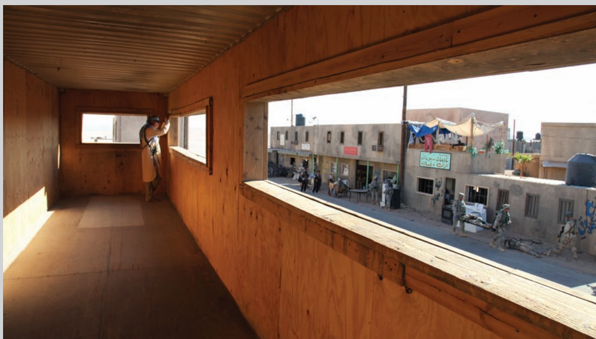
Emanuel Licha, Mirages , 2010, image tirée de la vidéo, 19 min 30 s

S'interrogeant depuis plusieurs années sur le regard fasciné que l'être humain porte sur la violence, Licha tente, dans cette exposition, de déconstruire la vision que nous nous faisons de la guerre en nous mettant face au simulacre d'une réalité que nous ne connaissons pas; celle de