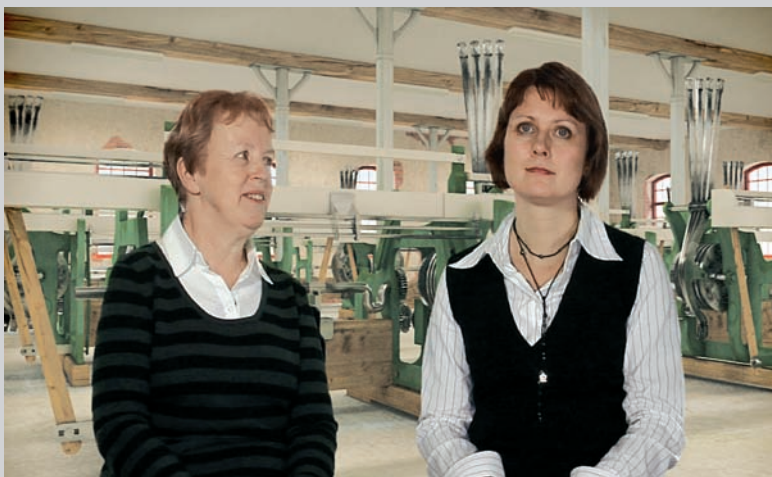
Esther Shalev-Gerz, Sound Machine , 2008, video still part of the installation, 94 x 60 cm

land in the traditional Sami area of northern Sweden, silently listening to her own words, yet remaining a readable presence, exemplifying the complexity of silence as a universalizing force not only in inviting audiences to listen but also in its profound ability to create responsibility in the listener to create meaning.