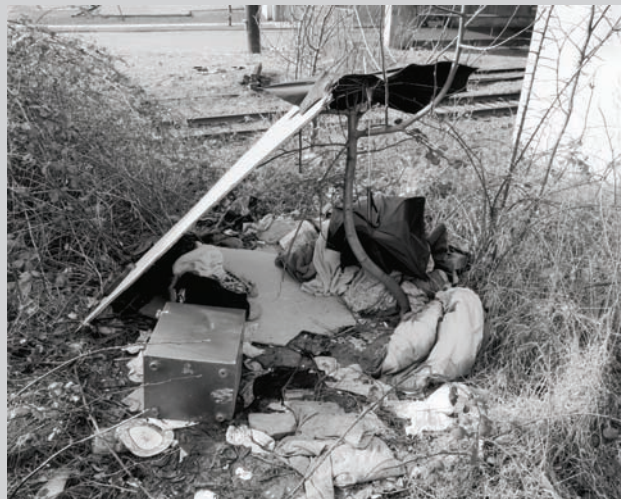
Roy Arden, Terminal City # 10 , 1999, gelatin silver print / épreuve argentique, 41 x 51 cm, coll. Osler.