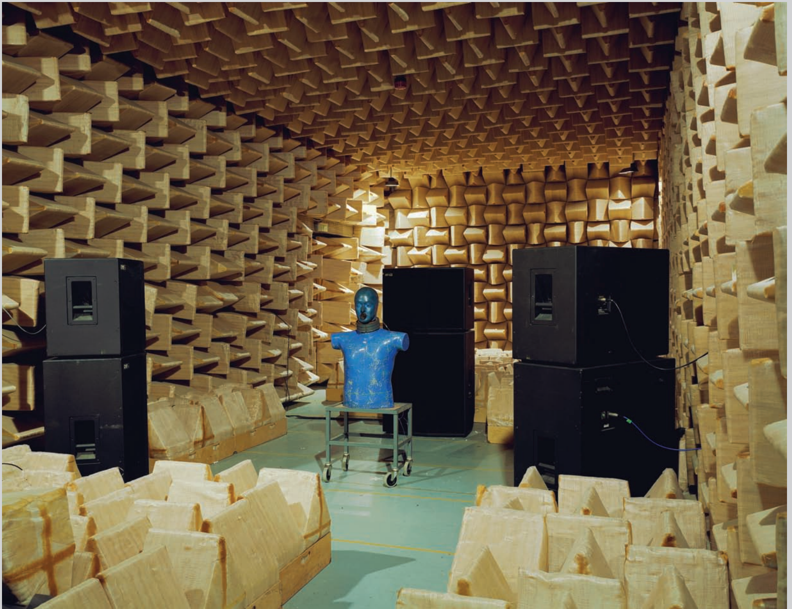
Lynne Cohen, Laboratory , 1999, Dye coupler print / épreuve chromogénique, 140 x 170 cm, coll. Osler, avec l'aimable permission/courtesy of Olga Korper Gallery.