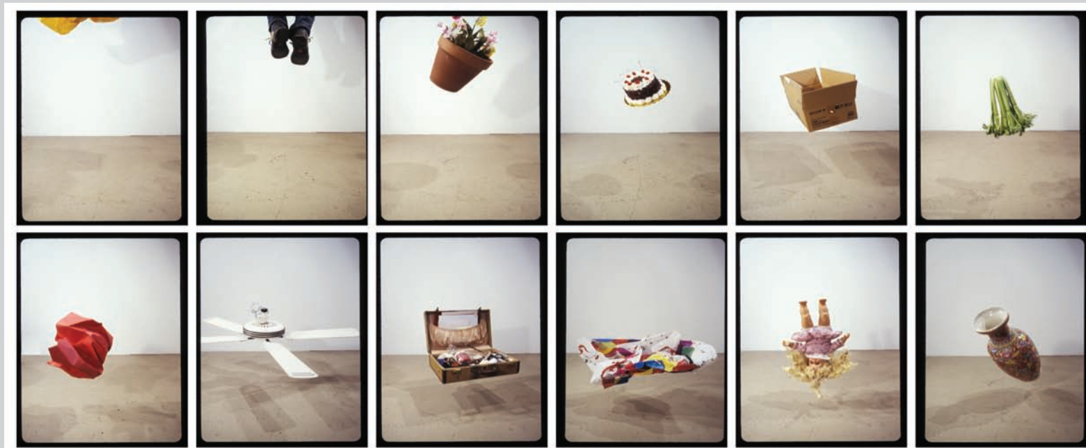
Gwenaël Bélanger, Chutes (objets) , 2003, série de 12 photographies, 50 x 66 cm (ch.).

Virginie Doré Lemonde a une maîtrise en Études cinématographiques portant sur la représentation de l'artiste moderne au cinéma. Au printemps 2009, elle a participé à l'organisation du festival de films de La Rochelle. Elle collabore également aux revues ETC et Ciel variable.