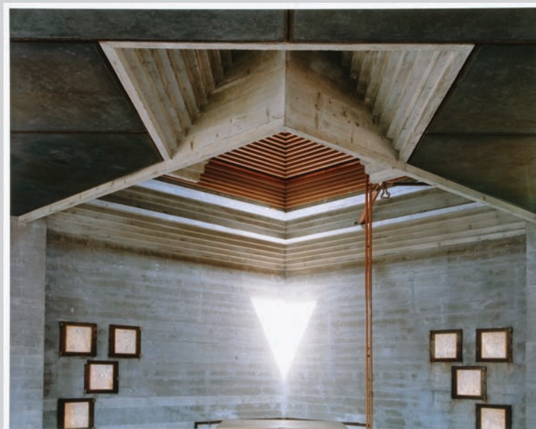
Guido Guidi, Brion's Family Tomba, San Vito d'Altivole: 12PM, Looking to the North , 2006, c-print, 60,8 x 76,4 cm, courtesy of the CCA.

James D. Campbell is a writer on art and independent curator based in Montreal. The author of over 100 books and catalogues on contemporary art and artists, he contributes frequently to visual arts publication across Canada.