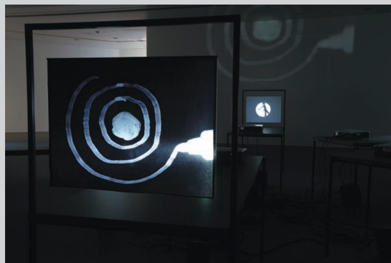
Manon De Pauw, Répertoire , 2009, video installation with six projections in loop, black and white, 3 mn 50 s, variable dimensions

These rhythms are based not only on corporeal authenticity but on the symbolic cartography of the body implicit in phenomenological discourse. This symbolic mapping of the body in the context of where it finds itself in time and space makes for a rare epiphany in the assimilation of this work. As Merleau-Ponty wrote, "What counts for the orientation of the spectacle is not my body as it in fact is, as a thing in objective space, but as a system of possible actions, a virtual body with its