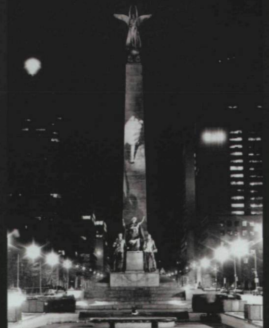
Krzysztof Wodiczko, projection publique au South African War Memorial, Toronto, 1983, organisée par la Ydessa Art Foundation, Toronto, reproduite avec l'aimable permission de la Galerie Lelong, New York.