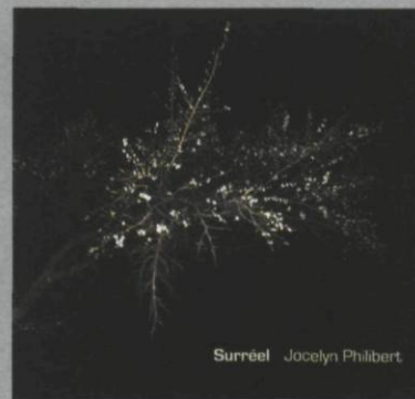
Jocelyn Philibert Surréal Éditions Sagamie, 36 pages texte de Jean-François Caron, 16 reproductions couleur, 2007