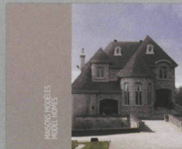
Isabelle Hayeur Maisons modèles / Model Homes Éditions Sagamie, 38 pages texte de Chris Balaschak, 11 reproductions couleur, 2008