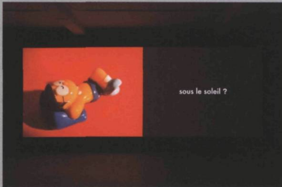
Le plan de la ville , 2006, installation vidéo, dimensions variable.

Cet enseignement dispensé par le temps, Henricks nous le décline à son tour à travers différentes métaphores – la ville, le corps, le bâtiment – qui elles-mêmes s'enchaînent. La ville prend la forme de cartes géographiques et de ruines romaines, de buildings et de graffitis. Ainsi, à la phrase