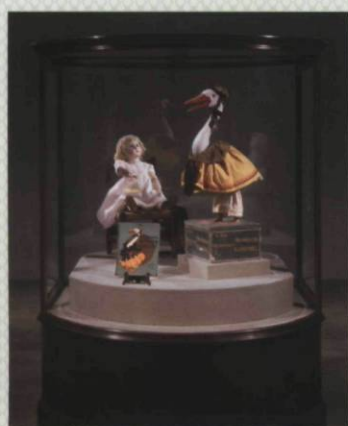
Predators & Prey , 2005, Toronto

ABOVE/EN HAUT André Kertész (1894-1985) The House of Silence , 1928