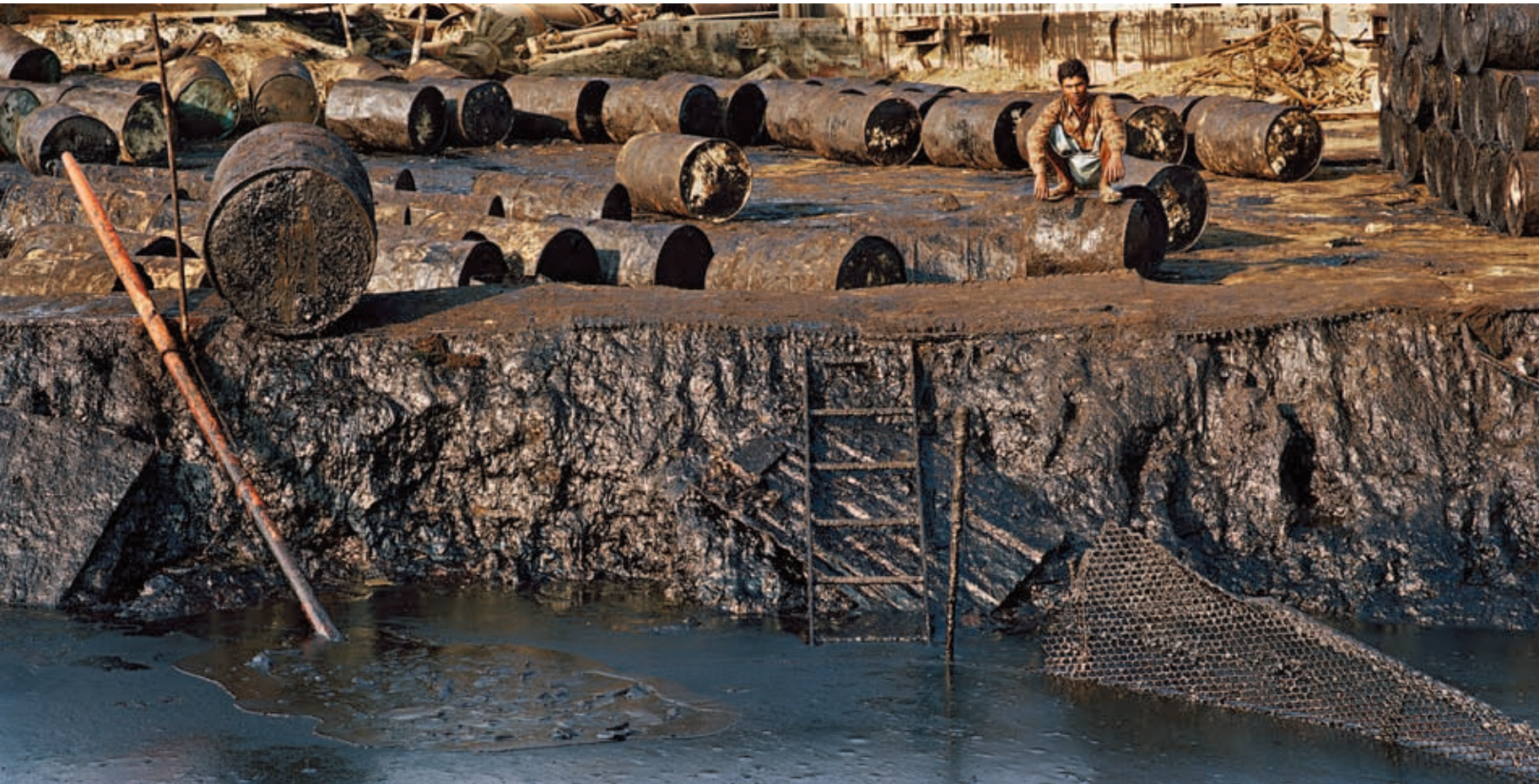
Shipbreaking #20, Chittagong, Bangladesh, 2000; PAGE 20 : Shipbreaking # 27 with Cutter, Chittagong, Bangladesh, 2000, épreuves chromogéniques / c-prints

beautiful, with which they share, it is true, some codes and idiosyncrasies. Immanuel Kant wrote, “The beautiful is that which, apart from concepts, is represented as the Object of universal delight.” If the beautiful is an intermediary between perceptivity and understanding, we must believe that the general tessitura of the images engages our perceptivity in a pleasant way, whereas it quickly turns out that their content staggers our understanding. Here, it is a question of a set order of things and what happens when our unbridled consumption of fossil fuels overturns that order. Burtynsky thus finds himself stimulating our perceptions to the maximum so that our comprehension of what is at work here will lead us to pure and simple consternation. The aestheticizing overload, the extremely realistic rendering, the vibrant colours, and the occupation of all planes and areas of the image are definitely intended to make the ethical shock even greater. Maximum aestheticism for maximum comprehension. We register the signs of beauty, but in the end we are taken aback at the primary cause of this overload. We have, or soon will, become the Mad Maxes of a world