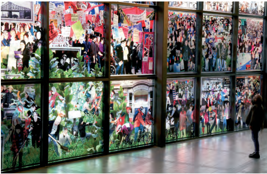
PAGES PRÉCÉDENTES ET SUIVANTE : Identité Centre-Sud , 2012, impression jet d'encre / inkjet print, 18 tableaux / panels 2 m 2 , ch. / ea PAGE 40: Vue de la murale / mural view, maison de la culture Frontenac, 72 m 2