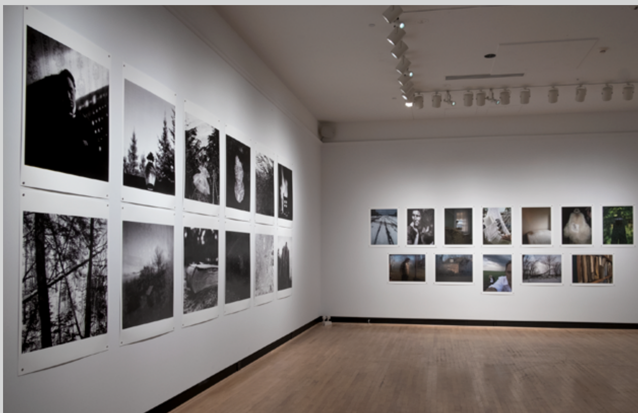
Vue de l'exposition, Galerie d'art Antoine-Sirois de l'Université de Sherbrooke, 2020, photo : François Lafrance

En plus, il fallait veiller à un certain équilibre et, ici, le nombre d'images retenues est suffisant pour donner une idée de la trame complète. Aucun des blocs ne vient voler la vedette, même si la taille des impressions de Miroirs acoustiques retient l'attention. Devant cette série, on s'interroge sur les masses montrées, dont les tons de gris se perdent dans les alentours et les végétaux. Ce sont des constructions paraboliques qui faisaient office de radars sur les côtes britanniques lors des deux guerres mondiales. On plaçait des microphones au point le plus cavé de leur concavité et on pouvait détecter les avions approchant. Certains se trouvent à Dungeness, en face de Dieppe, qui a aussi été un lieu