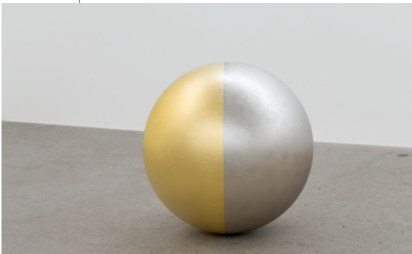
Sphère (jour et nuit) / Sphere (day and night) , 2019, stainless steel, gold and palladium leaf / acier inoxydable, feuille d'or et de palladium, 70 cm (diameter/diamètre)

A delicate pattern of gold leaf on the surface of the photograph extends and then abruptly halts the illusionary, absorptive quality of the image. It shimmers with the diffused light in the gallery and heats up the scene, as though the winding path leading into the desert were ablaze with the radiance of the sun. This perception