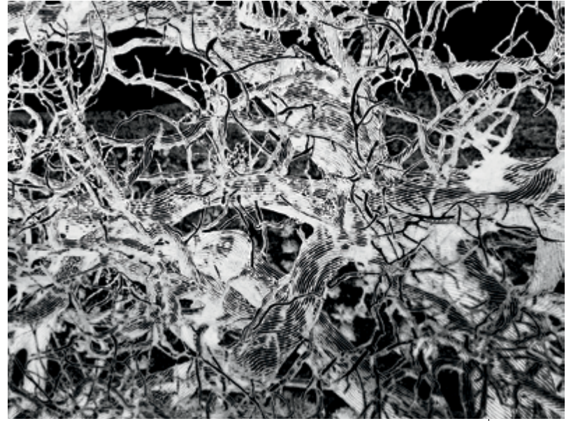
Arbre seul (la nuit) / Lonely tree (night), détail/detail, 2016 Lasal matte paper, mounted on Diebond, palladium-leaf enhancements / papier Lasal matte, monté sur Diebond, rehauts de feuille de palladium, 304 x 304 cm

In the second room, light is replaced by darkness. Two monumental photographic works – one square and the other a horizontal diptych – face each other across an open space. Both are rendered as black-and-white negative images, creating an otherworldly, nighttime effect. Both are enhanced with bold applications of palladium, adding drama and intensity. In both, pitch-black skies join shimmering land forms along sloping horizon lines that introduce instability into the images.