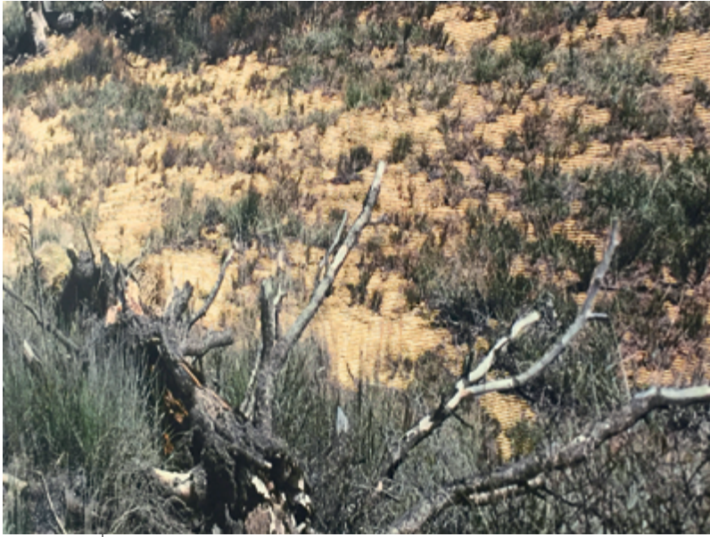
Arbre seul (le jour) / Lonely tree (day), détail/detail, 2017 Lasal matte paper, mounted on Diebond, gold-leaf enhancements / papier Lasal matte, monté sur Diebond, rehauts de feuille d'or, 243 x 304 cm

comes like a flash, a moment of acute experience – a punctum – and disappears almost as quickly, as flat, evenly painted lines of gold come into focus. Meticulously rendered according to a precise mathematical pattern, the lines become an abstract drawing – a nod, perhaps, to the delicate geometry of Agnes Martin, an artist who, like Cadieux, was lured by the desert. The gold striations hum with an electrical energy that brings to mind the scanning technology used to create the picture and my own desire to see, to scan the work for its message.