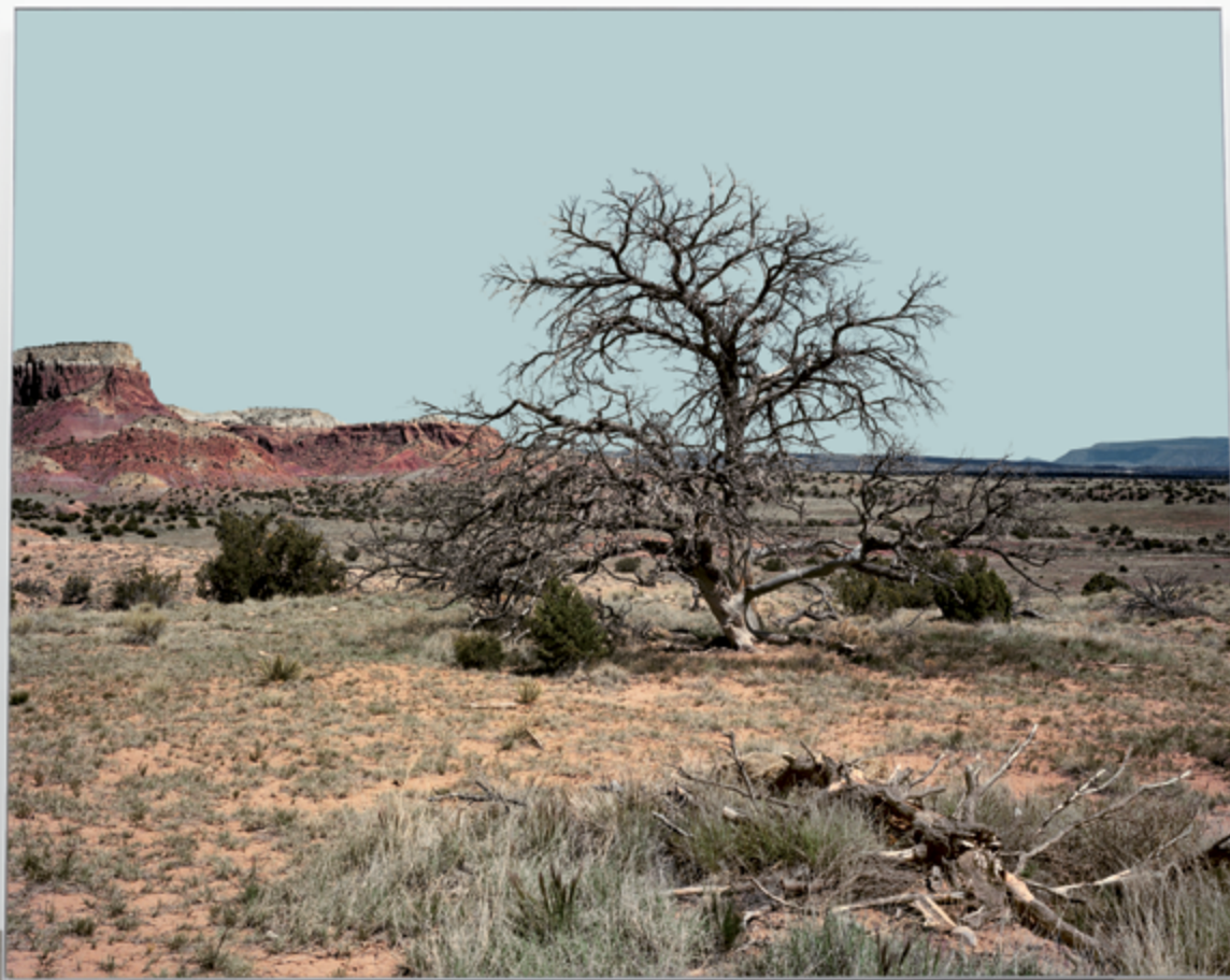
Arbre seul (le jour) / Lonely tree (day), 2017 Lasal matte paper, mounted on Diebond, gold-leaf enhancements / papier Lasal matte, monté sur Diebond, rehauts de feuille d'or, 243 × 304 cm