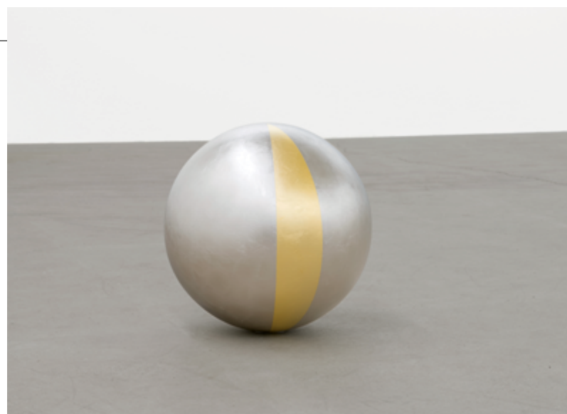
Sphère (aube) / Sphere (dawn), 2019 stainless steel, gold and palladium leaf / acier inoxydable feuille d'or et de palladium, 55 cm (diameter/diamètre)

It is the sky that knocks the image into the contemporary sublime – a flat plane of velvety black punctured by a vortex of