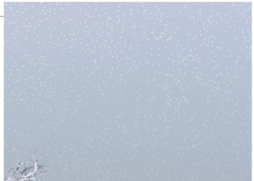
Arbre seul (à l'aube) / Lonely tree (dawn) , 2018, détail/detail