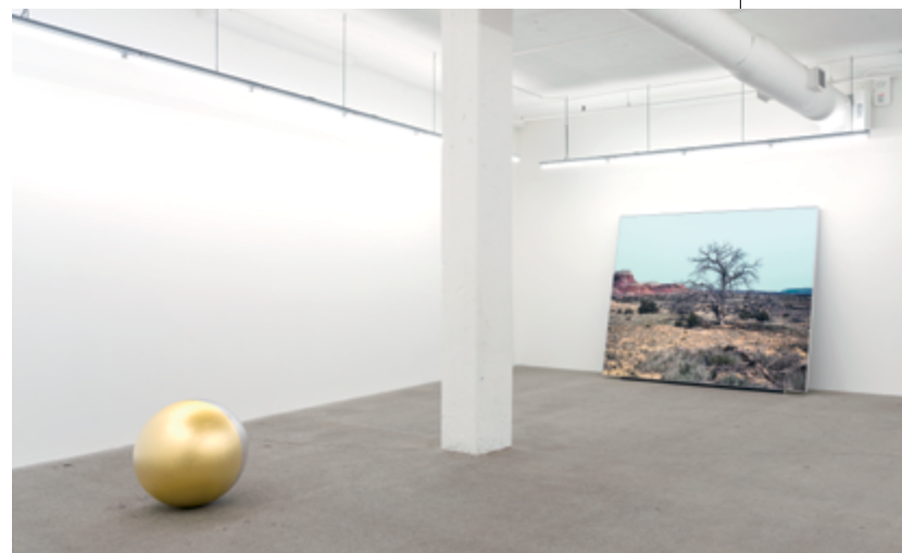
Ghost Ranch , exhibition view / vue d'exposition, galerie René Blouin

A monumental photograph in a simple frame leans against a wall in the first room of the gallery; before it, beyond a column, a gilded sphere sits on the floor. I am struck by the simple geometry of the installation – a rectangle and a sphere – and the way it defines and activates the space. The horizontal axis and rectangular shape of the photograph align with the logic of the architecture, while its pitch and mass give it a conditional, bodily presence. The sphere,