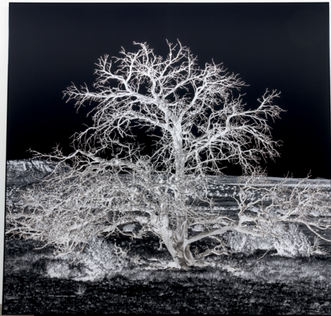
Arbre seul (la nuit) / Lonely tree (night) , 2016 Lasal matte paper, mounted on Diebond, palladium-leaf enhancements / papier Lasal matte, monté sur Diebond, rehauts de feuille de palladium, 304 × 304 cm

De fins rubans de palladium peints sur la photographie tracent la forme découpée et la surface sinueuse de l'arbre, lui donnant une allure incandescente surnaturelle. Tout comme les sels d'argent