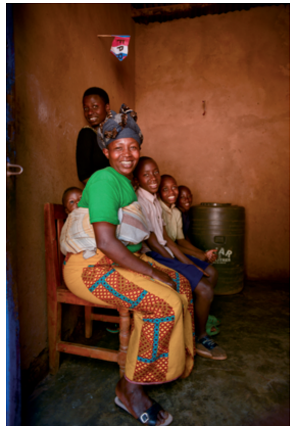
LEFT TO RIGHT TOP TO BOTTOM / DE GAUCHE À DROITE, DE HAUT EN BAS Samer Muscati Faustin , 2018, 76 × 51 cm ; Marie Claire , 2018, 91 × 61 cm ; Gloriose , 2008, 76 × 51 cm ; Marie Louise , 2018, 76 × 51 cm ; Hyacintha , 2018, 91 × 61 cm