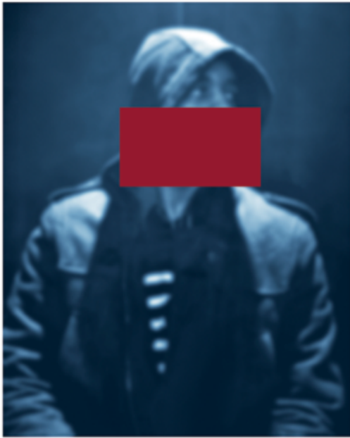
Carrie Mae Weems All the Boys (Blacked 3) , 2016 courtesy of the artist and Jack Shainman Gallery / permission de l'artiste et de la Jack Shainman Gallery