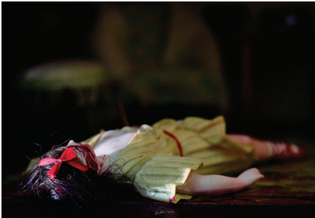
Dark Bathroom, 76 x 102 cm ; Parsonage Parlor (doll), 18 x 11 cm