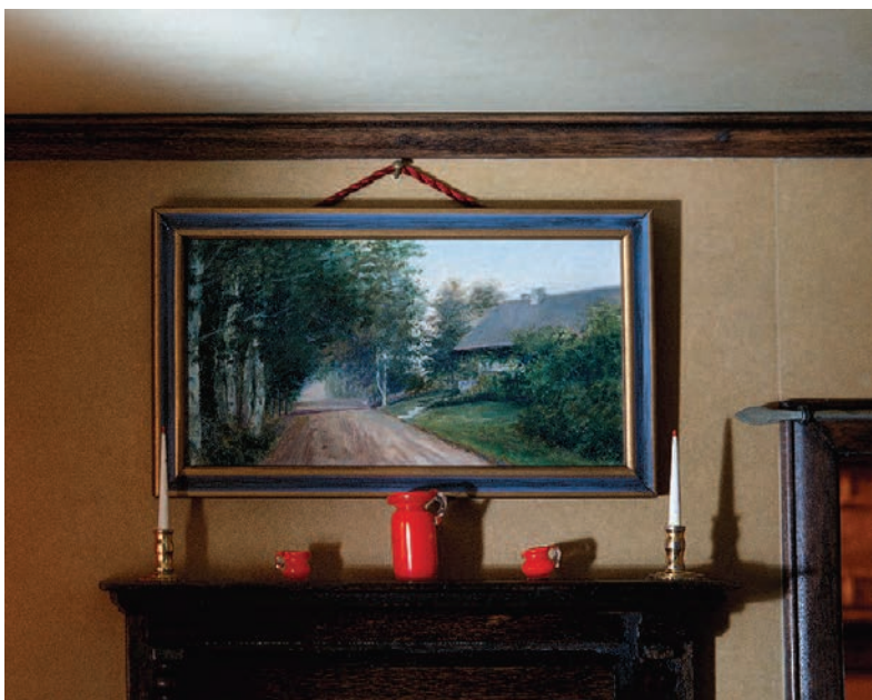
Living Room , 102 x 127 cm