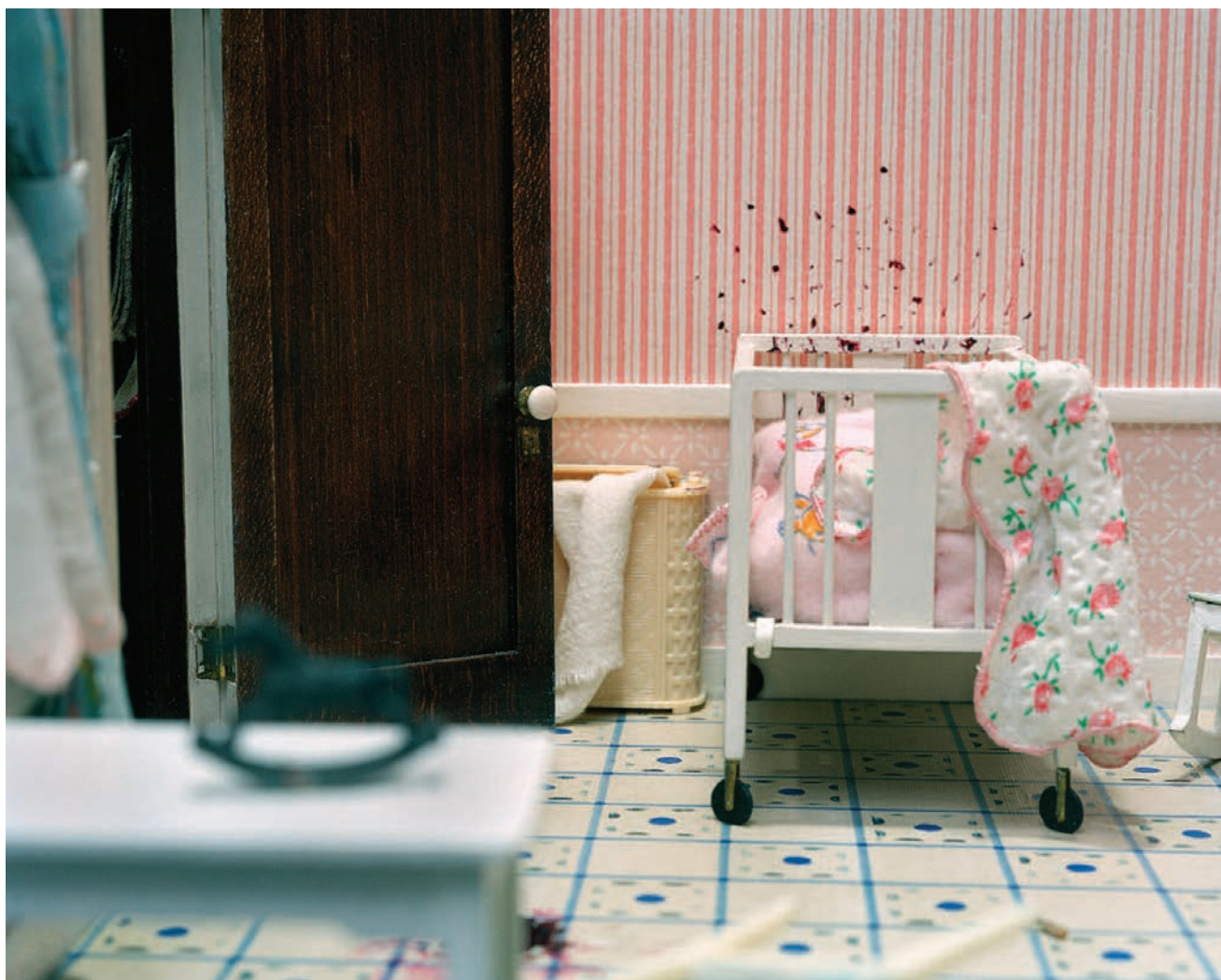
Three Room Dwelling (baby's crib) , 28 x 36 cm; PAGES 29 A 34 : de la série / from the series The Nutshell Studies of Unexplained Death , 2004, épreuves chromogéniques / c-prints

CORINNE MAY BOTZ, THE NUTSHELL STUDIES OF UNEXPLAINED DEATH