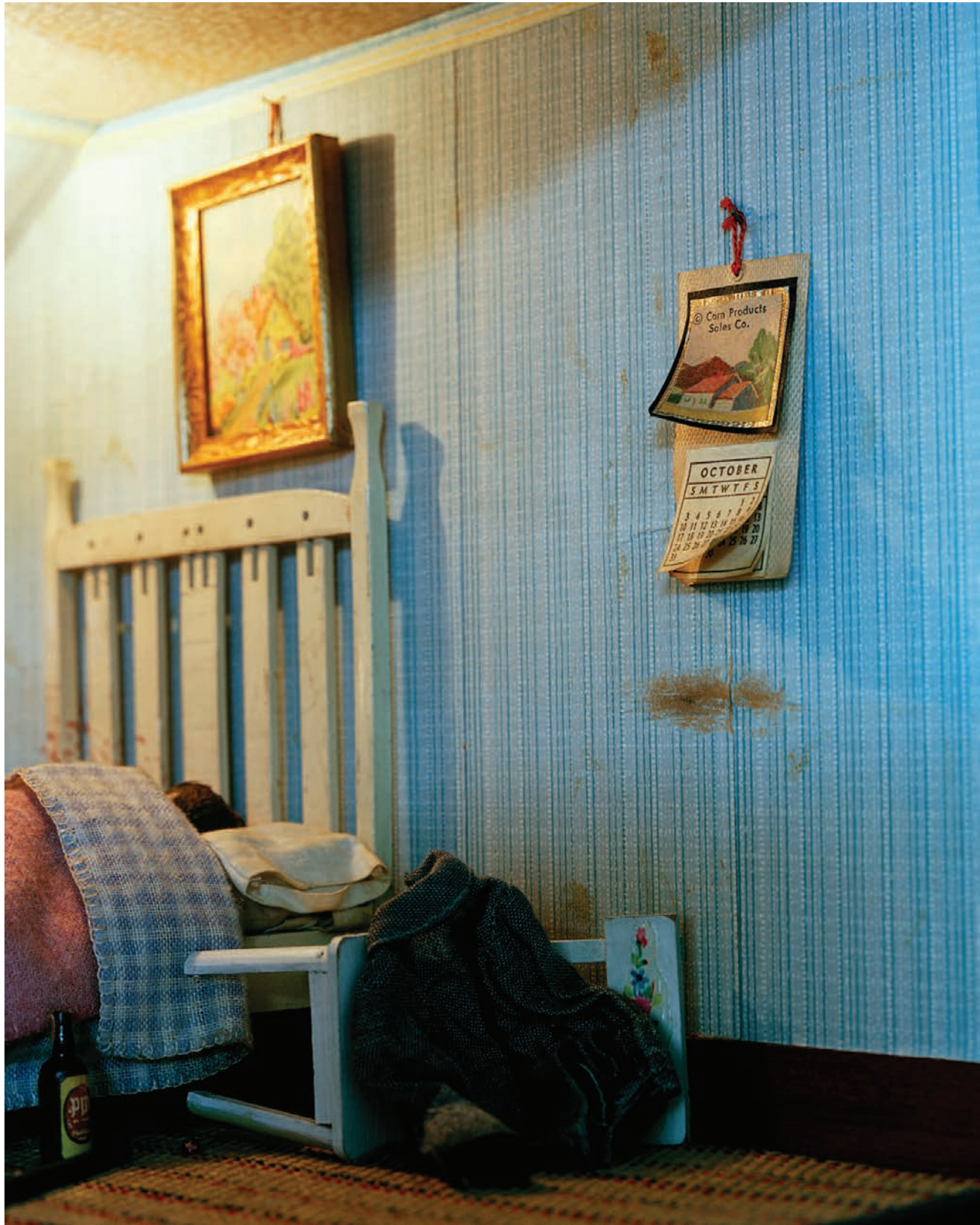
Blue Bedroom, 127 x 102 cm