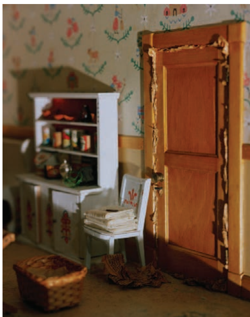
Three Room Dwelling (gun), 28 x 36 cm