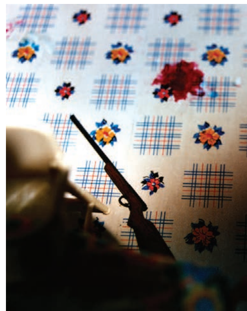
Three Room Dwelling (gun) , 28 x 36 cm

C'est aussi les espaces intimes et les lieux reclus qui semblent animer la démarche photographique de Corinne May Botz, comme en témoigne son projet Haunted Houses qui consistait à recueillir les témoignages de personnes attestant vivre dans un lieu hanté, et dont « les maisons » font l'objet d'une série de photos où rien de vraiment spectral ne semble devoir être photographié, sinon un rayon de lumière, un détail, un pan de mur ou une trop banale chambre à coucher. Il suffit du lieu, pourrait-on dire, et de la charge du témoignage qui atteste que ce lieu est, en quelque sorte, travaillé de l'intérieur par un drame invisible. Le lieu est ici un espace partagé, habité, hanté par quelque chose qu'on ne voit pas, et qui ne peut que magnétiser le regard à la recherche des indices qui pourraient en supporter l'hypothétique manifestation.