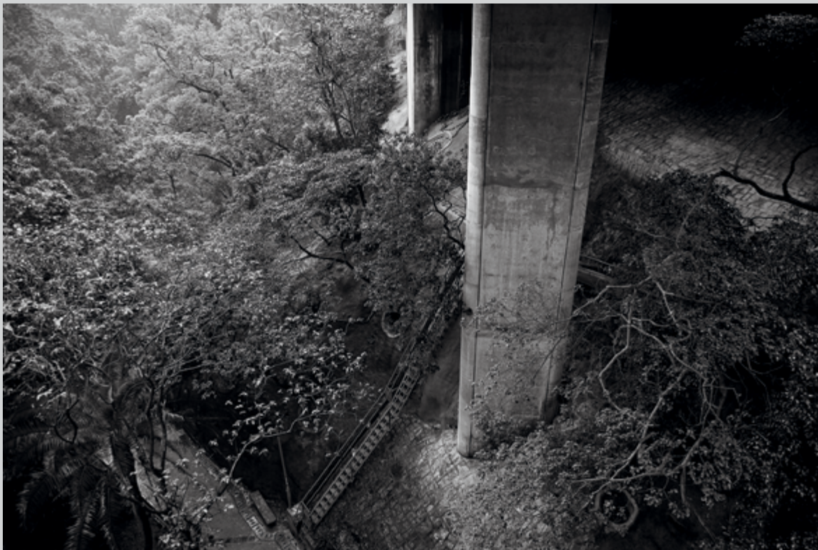
Sans titre, de la série Les lieux suspendus , 2013-2017, impression numérique sur papier chiffon, 86 × 122 cm